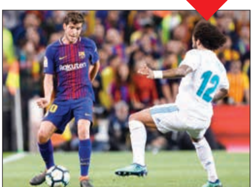
سيرجي روبرتو في مواجهة مارسيلو خلال الكلاسيكو الأخير

قرر الاتحاد الإسباني لكرة القدم أمس إيقاف نجم برشلونه الإسباني اللاعب سيرجي روبرتو، أربع مباريات على خلفية تعديه على البرازيلي مارسيلو، لاعب ريال مدريد، خلال مباراة كلاسيكو الكرة الإسبانية التي جمعت بين الفريقين يوم الأحد الماضي. واعتمدت لجنة المسابقات التابعة للاتحاد الإسباني لكرة القدم في تقريرها للعقوبة المذكورة على تقرير حكم اللقاء المخاضرو هيرنانديز الذي أشهر البطاقة الحمراء المباشرة لسيرجي إثر تعديه على أحد لاعبي الفريق المنافس بذراعه وبقوة مفرطة ومن دون كرة. وهكذا، لن يعود الظهير الأيمن لبرشلونة لخوض أي مباريات حتى نهاية الموسم الجاري، حيث سيغيب عن المباريات الأخيرة لبرشلونة في الدوري الإسباني «الليغا»، أمام فياريال ولبنانتا وريال سوسيداد، بالإضافة إلى ذهاب بطولة كأس السوبر الإسباني. وقررت اللجنة أيضاً تغريم برشلونه 1400 يورو وروبرتو 3005 يورو.