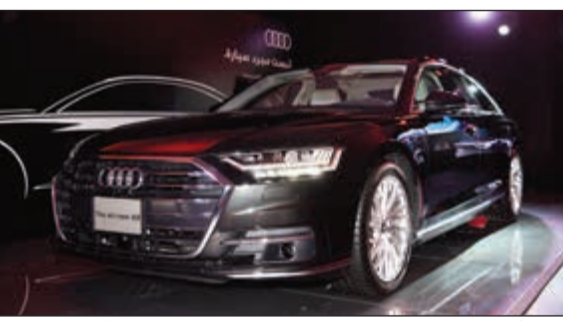
أودي A8 الجديدة كليا بعد الكشف عنها (محمد هندواوي)

«أودي الكويت» تطلق الجيل الرابع من A8 الجديدة كليا