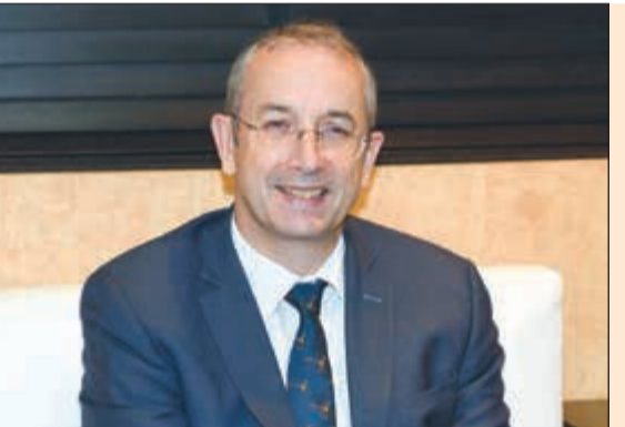
السفير البريطاني مايكل دافنبورت (هاني الشمري)