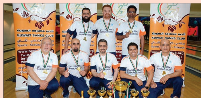
فريق بنك برقان الفائز بالمركز الأول في بطولة بولينغ المصارف 21

سجل بنك برقان، أحد أكثر البنوك الكويتية تطورا، انتصارا مهما في بطولة البولينغ التي نظمها نادي مصارف الكويت بعد فوزه بالمركز الأول في الفئات الأربع للمسابقة. وهذه ليست المرة الأولى التي يتفوق فيها فريق بنك برقان، إذ سبق له أن حقق انتصارات ومراكز متقدمة في أكثر من بطولة وأخرها بطولة الدوري العام للموسم الحالي وبطولة كأس المصارف العام الماضي، بفضل تفانيه وجهوده المكثفة في التدريب وإصراره على الفوز.