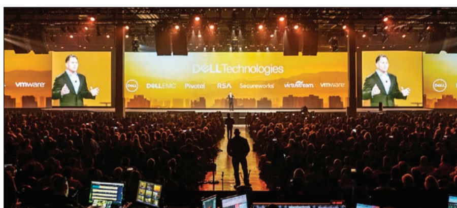
جانب من مؤتمر Dell السنوي

شاملة لتكنولوجيا المعلومات بحيث يمكن استخراج جميع البيانات بسرعة وكفاءة وفعالية وتحولها إلى رؤى الاصطناعي والتعلم الآلي إلى واقع - عندما تتمكن الشركات من تقديم منتجات وخدمات وحلول وتجارب أفضل استناداً إلى القرارات المدعومة بالبيانات، وهذا ما نعمل عليه - نتائج أفضل للأعمال توفرها الحلول