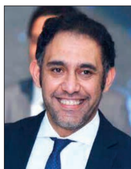
عمرو مصطفى أفضل ملحن 2017