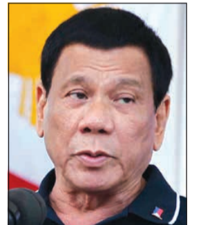
الرئيس الفلبيني رودريغو دوتيرتي

في الكويت ريناتو اوفيليا شخص غير مرغوب فيه. انزعج الرئيس الفلبيني رودريغو دوتيرتي من وضع صورته على غلاف الطبيعة الدولية لجلة التايم، قائلاً إنها تصورته على أنه «وحش». وكان صورة دوتيرتي قد جاءت على غلاف مجلة التايم في طبعة 14 مايو 2018، تحت عنوان «صعود الرجل القوي»، جنباً إلى جنب مع صورة الرئيس الروسي