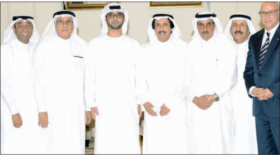
السفير الشيخ عزام الصباح مع سمو الشيخ سلطان بن حمدان بن زايد آل نهيان وبعض الحضور

بتعيينه سفيرا بالبحرين، كما هنأه بالاحتفالات الوطنية الاماراتية بعام زايد وبمئوية الشيخ زايد، مشيدا بالتاريخ المشرف والكبير لحكيم العرب الشيخ زايد أحد القادة الملهمين في العالم العربي وأحد المؤسسين لمنظمة مجلس التعاون الخليجي. حضر الحفل السفراء العرب المعتمدون لدى مملكة البحرين ومجموعة من الفعاليات الاقتصادية والاجتماعية ينقدمهم مستشار عامل البحرين لشؤون الاعلام نبيل بن يعقوب الحمير ورئيس غرفة تجارة وصناعة البحرين السيد سمير ناس.