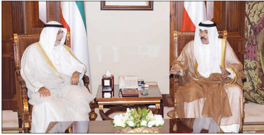
سمو نائب الأمير وولي العهد الشيخ نواف مستقبلاً الشيخ د.محمد الصباح

سمو نائب الأمير وولي العهد الشيخ نواف مستقبلاً الشيخ د.محمد الصباح.