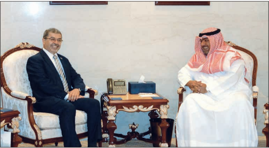
الشيخ ثامر العلي خلال لقائه السفير العراقي علاء الهاشمي

تطرق الى بحث العلاقات الثنائية التي تجمع الجانبين وسبل تعزيزها وتطويرها. وأشار البيان الى ان اللقاء بحث ايضا اهم القضايا المشتركة التي تهم البلدين على الساحتين الإقليمية والدولية.