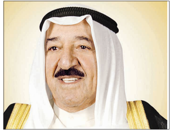
صاحب السمو الأمير الشيخ صباح الأحمد

المطار سمو نائب الأمير وولي العهد الشيخ نواف الأحمد ورئيس مجلس الأمة مرزوق الغانم وكبار