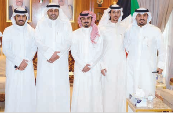
محمد الجبري خلال لقائه الشعراء المشاركين في مسابقة كتارا

عالياً انحياز الفلبين للقضايا العادلة. وأشار الجبري الى ان من سياسة وزارة الاعلام مد جسور التواصل بين أجهزة الدولة المعنية والمقيمين وكذلك اوطانهم، مضيفاً ان ذلك يتجلى بتخصيص ساعات للبحث باللغة الفلبينية عبر اثير إذاعة الكويت. من جانب آخر، بحث الوزير الجبري أيضاً مع سفير اليابان لدى الكويت تاكاشي اشيكو أوجه التعاون المشترك وسبل تطويرها لاسيما في الجوانب الإعلامية والثقافية والشبابية. وقالت «الاعلام» في بيان صحفي ان الوزير الجبري استعرض على هامش