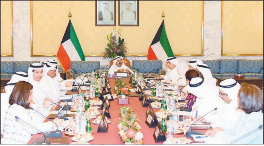
الشيخ ناصر صباح الأحمد مترسماً اجتماع المجلس الأعلى للتخطيط

الصبح في تصريح نقله بيان صادر عن «التخطيط» إن الاجتماع شهد مناقشة البنود المدرجة على جدول أعماله ومنها مذكرة برأي لجنة التنمية البشرية والمجتمعية بشأن تطوير التعليم في الكويت. وأضاف الصباح أن الاجتماع ناقش كذلك بندا يتعلق بتحديات الإصلاح الاقتصادي والمالي ومسارات المعالجة في ضوء التقارير والدراسات السابقة ذات العلاقة.