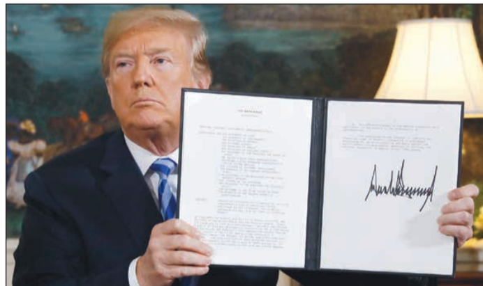
الرئيس الاميركي دونالد ترامب يعرض القرار الذي وقعه بعد اعلانه الانسحاب من الاتفاق النووي وتجديد العقوبات على ايران

الجنود الاميركيين. وعلى الفور تحدث رئيس الوزراء الاسرائيلي نتنياهو مشيداً بالقرار التاريخي، وشكر ترامب على قيادته الشجاعة لمواجهة ايران.