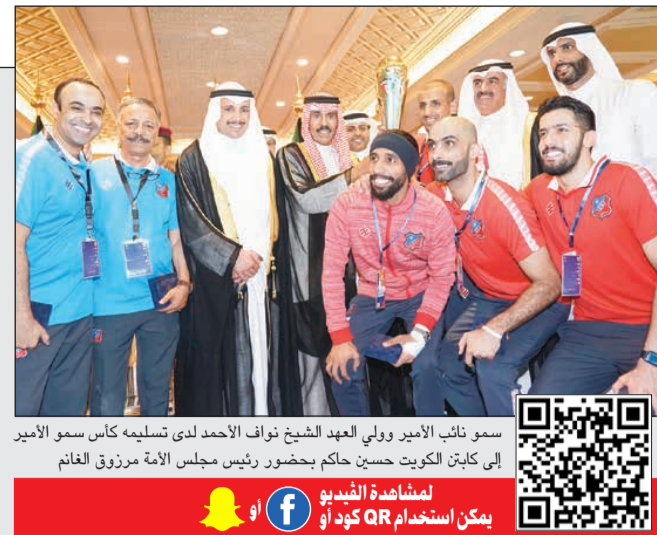
سمو نائب الأمير وولي العهد الشيخ نواف الأحمد لدى تسليمه كأس سمو الأمير إلى كابتن الكويت حسين حاكم بحضور رئيس مجلس الأمة مرزوق الغانم

ثوبل مرة في الكويت شاهد الصفحة بتقنية الواقع المعزز حمل تطبيق Zappar