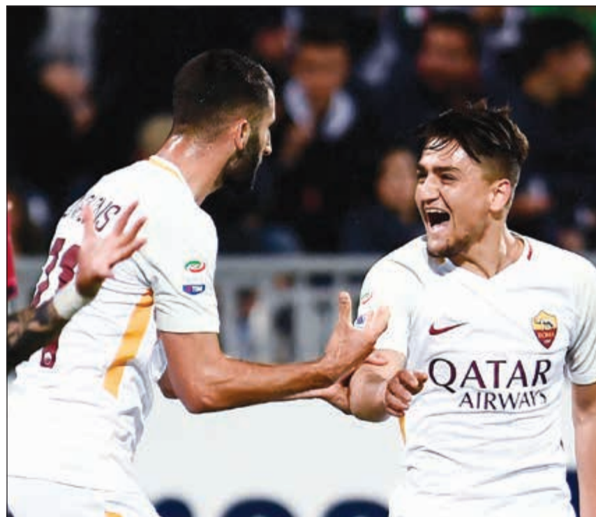
أوندير وفرحة هدفه الثمين

وأضاف: سنلعب أمام يوفنتوس ليس من أجل التعادل، حتى لو كنا نحتاج