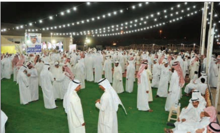
أعداد كبيرة من الناخبين بالمقر