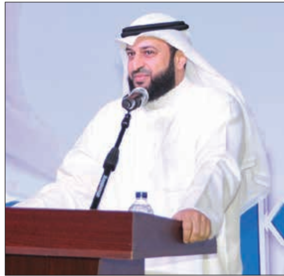
النائب عبدالله فهاد متحدثا