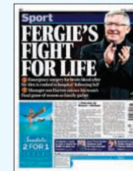
ديلي ميل: فيرغي يكافح من أجل الحياة