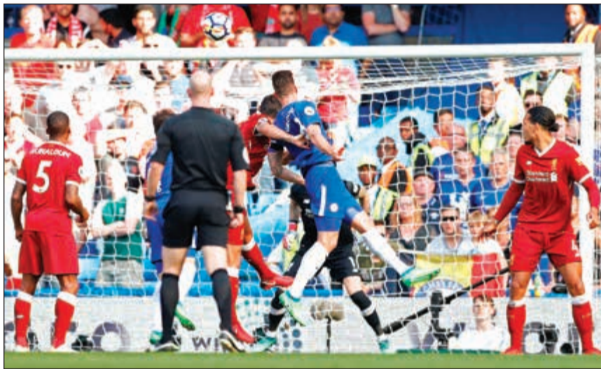
جيرو يسجل هدفاً على ليفربول