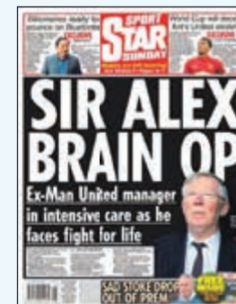
ديلي ستار: في المخ للسير أليكس