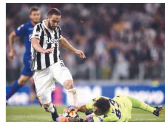
حارس بولونيا يمسك الكرة قبل مهاجم يوفنتوس غونزالو هيغواين

مرة أخرى بهدف سجله مارك هامسيك في الدقيقة، 71 قبل أن يتعادل توريانو مرة أخرى عن طريق لورينزو دي سيلفستري في الدقيقة 83. ورفع توريانو رصيده إلى 48 نقطة في المركز العاشر، كما رفع نابولي رصيده إلى 85 نقطة في المركز الثاني بفارق ست نقاط عن يوفنتوس المتصدر، والذي أصبح بحاجة لنقطة واحدة فقط في الجولتين المتبقيتين لينتج رسماً باللقب.