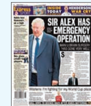
ديلي إكسبريس: السير أليكس يخضع لعملية عاجلة