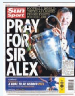
ذا صن: صلوا للسير أليكس