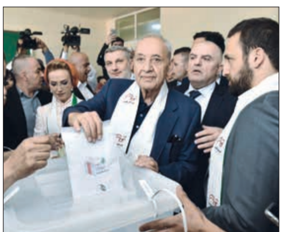
... ورئيس البرلمان نبيه بري يضع «صوته» في الصندوق

من جهتها، اتهمت رئيسة الكتلة الشعبية ميريام سكاف «حيتان المال» بدفع الاموال التي تخدم لاجلها مصالحها الشخصية، وقالت: نحن نطالب بالشفافية والعدالة في العملية الانتخابية، وندعو الى وقف الحملات الدعائية التي تهدف الى التلاعب بالنتائج الانتخابية.