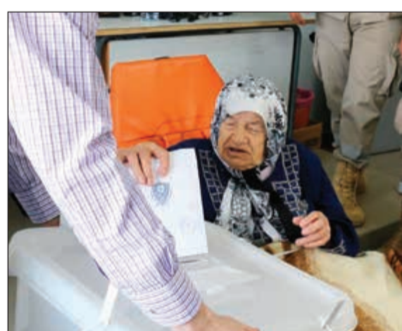
عجوز لبنانية لم يمنعه المرض من التصويت