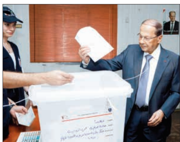
رئيس الجمهورية العماد ميشال عون يذلي بصوته

ضدنا في زحلة وتعرض لاشاعات عارية من الصحة، وقالت: يا عيب الشوم عليهم، هناك حملة ممنهجة ضدنا ونحن مرتاحون، ولذلك باستخدام هذه الاساليب ضدنا، وادعو الى توقيف من اعتدوا على مراكزنا. وقد حصلت مناوشات بين انصار ميريام سكاف ومناصري القوات اللبنانية، والى طرابلس، انتقل وزير الداخلية نهاد المشنوق بواسطة مروحية عسكرية لمتابعة المعركة الانتخابية الناشبة بين تيار المستقبل ولائحة العزم برئاسة الرئيس نجيب ميقاتي ولائحة لبنان والسيادة برئاسة اللواء اشرف ريفي.