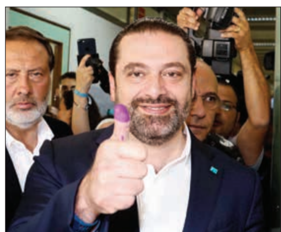
رئيس الحكومة سعد الحريري رافعا اصبعه المصوب بعد الاقتراع

التخوين، كيف ستشكلون حكومة واحدة مع اصحاب هذه الحملات؟ فاجاب: نحن في بلد ديموقراطي وكل له الحق بقول ما يريد.