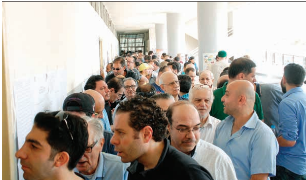
ناخبون ينتظرون دورهم للإدلاء بأصواتهم