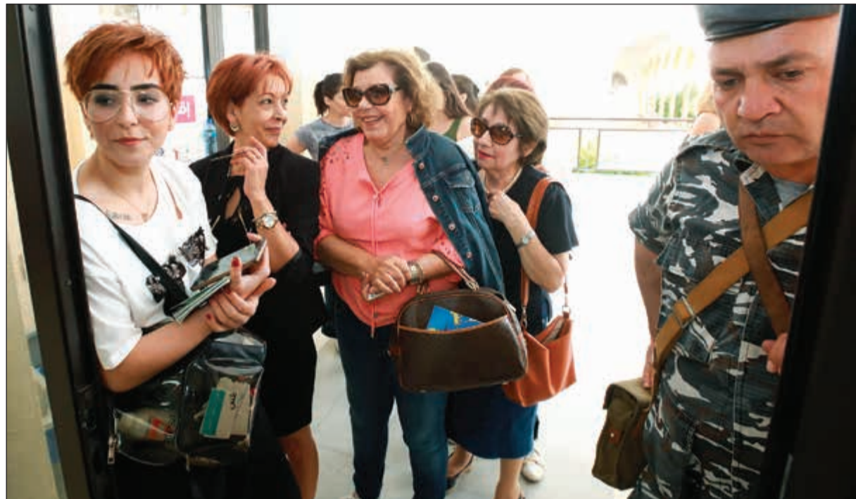
.. وسيدات من الأشرفية نحو صناديق الاقتراع