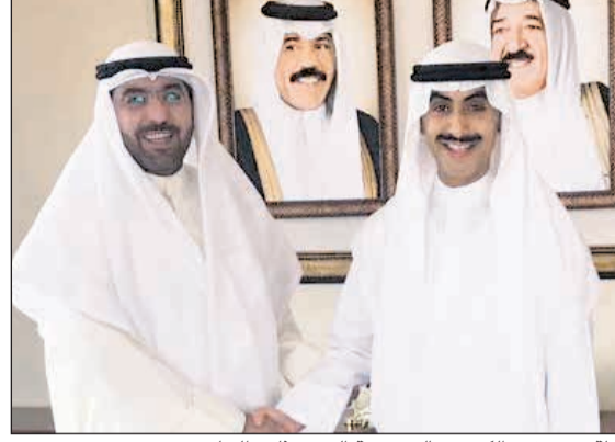
لقطة مع سفير الكويت بالسعودية الشيخ ثامر الجابر