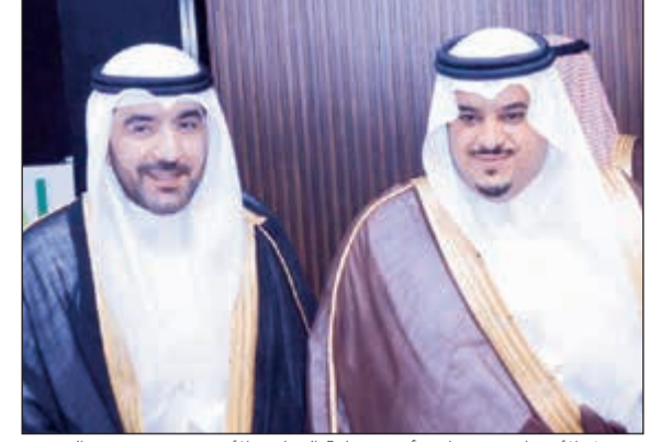
مشعل الأنصاري مع نائب أمير منطقة الرياض الأمير محمد بن عبدالرحمن

من أحداث سنة الجوع. وأوضح أن مبادرة «100» ترصد عدداً من الظواهر الاجتماعية في الزمن الحالي، وكيفية التعامل والتعاون في تلك المرحلة، والآثار الاقتصادية والاجتماعية التي سببتها، وما نعيشه اليوم من نعمة من الله عز وجل، وجب علينا شكرها وحفظها للأجيال القادمة. وأشار إلى تجربة بنوك الطعام في دول العالم وضرورة تطبيقها وسعي بنك الطعام الكويتي إلى بناء شركات دولية والاستفادة من الخبرات وبناء منظومة عمل متكاملة الأداء والمحتوى واحترافية في المنتج.