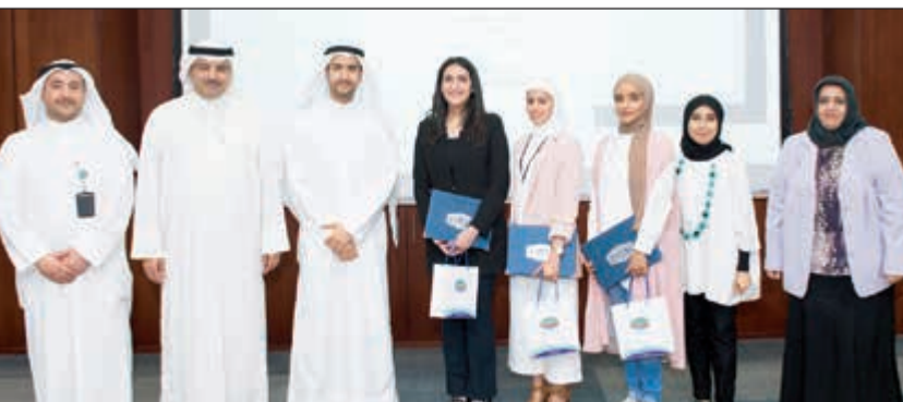
جانب من تكريم بعض الطلبة

باستعراض دراسات ميدانية حول خبراتهم التقنية التي اكتسبوها خلال تدريبهم لمدة ثلاثة أشهر في المجمع الصناعي والمقر الرئيسي لإيكويت في الكويت.