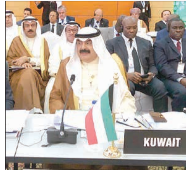
خالد الجار الله مترشسا وفد الكويت

عاتها السعي الجاد بالتعاون مع بقية الأعضاء لإحياء ذلك الملف وتحريكه في سعي لإيجاد تسوية شاملة تنهي هذا الصراع وتعيد للعالم أمنه واستقراره. وبشأن الملف السوري، قال: تدخل أكبر كارثة إنسانية يشهدها عالمنا اليوم عامها الثامن مثلة بالأزمة السورية بما سجلته كأكبر مجتمع لاجئين ونازحين في العالم وعشرات الآلاف من القتلى والجرحى، ناهيك عن الدمار الهائل الذي لحق بذلك البلد الشقيق، ولقد كان للإفلات من العقاب دور كبير في الاستمرار بممارسة أبشع الانتهاكات لقرارات مجلس الأمن وقوانين حقوق الإنسان وانطلاقا من مسؤولياتنا الدولية والإسلامية والإنسانية فقد عملنا من خلال عضويتنا غير الدائمة في مجلس الأمن بالتعاون مع السويد باستصدار القرار 2401