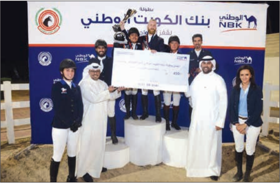
بنك الكويت الوطني يكرم الفائزين الثلاثة في المركز الأول لسباق الجائزة الكبرى

الكويت الوطني تجاه الرياضة وفي مقدمتها سباق المشي السنوي الذي يخلقه إلى جانب البطولات الرياضية التي يراها ودعمه المتواصل للرياضيين الكويتيين وتشجيعه للتميزين منهم والإقبال. ولفت إلى أن الهدف هو دعم الفرسان الناشئين، وتطوير مستوى هذه الرياضة لتأسيس جيل جديد من الفرسان، وتمكينهم من المنافسة بقوة على الألقاب الدولية. وانطلقت بطولة بنك الكويت الوطني لقفز الحواجز بمشاركة أكثر من 200 فارس وفارسة يمثلون جميع الأندية المحلية، وخصصت لها جوائز كبرى. وتضمنت البطولة أربعة ارتفاعات مختلفة هي الفئة المبتدئة على ارتفاع 80-60 سم والفئة المتوسطة على ارتفاع 105 سم ثم ارتفاع 115 سم، تبعه شوط الجائزة الكبرى بارتفاع 135 سم، واختتمت بشوط الجائزة الصغرى على ارتفاع 125 سم.