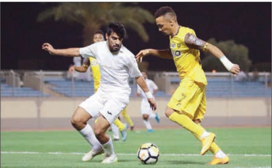
أحد جدد فوزه على الطائي