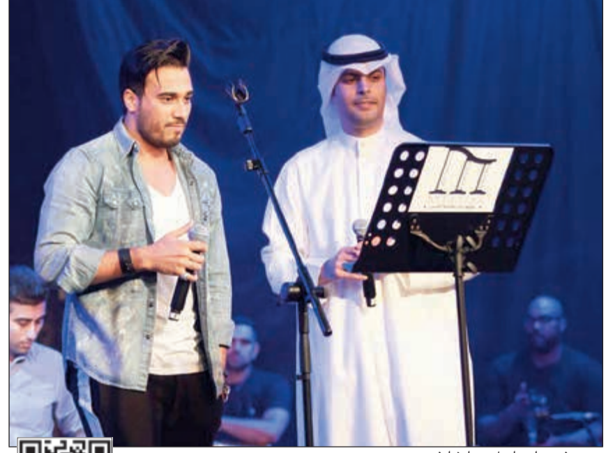
«ديو» فهد وإسماعيل...ها شايغ

قدمت شركة «ميلودي» للإنتاج الفني مساء أمس الأول حفلا غنائيا على مسرح دار المهين الطبية بالجابرية، بمشاركة فرقة «كونسرت» الموسيقية والفنان فهد السالم ومعه المطرب السعودي إسماعيل مبارك، واللذين أبدعا بتقديم عدد من الأغاني التي انتمت بالرومانسية، وذلك بحضور الزميل خالد الغريب كممثل للشركة المنتجة إضافة لعدد من الفنانين والصحافيين. كانت الوصلة الأولى مع فهد السالم والذي بدأ بأغنية «حلم عمري»، واتبعها بـ «تحذره البشر»، لراشد الماجد، ثم غنى «يا عيون» لعبدالمجيد عبدالله، وبعدها قدم «أحبك» لحسين الجسمي، وشدا لـ «القيثارة»، نوال الكويتية أغنية «مثل النسيم»، والحقها بأغنية عبدالمجيد عبدالله «روحي تحب»، ثم «ندامة» لمجد المهندس، وتبعها بـ «وش تبون»، والتي تفاعل معها الحضور بشكل كبير، ليغني بعدها «عطشان» للمهندس أيضا، و«سمي الروح»، ورددتها