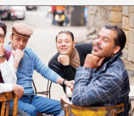
مشهد من «بوعمر المصري»

يبذل أقصى جهده في ظل الظروف الصعبة، لأننا صورنا في أماكن بعيدة بين الصحاري والجبال، واحتجنا بحكم الأحداث إلى تنفيذ مشاهد خارجية كثيرة، كما سافرنا إلى رومانيا وتقلنا بين عدد من المناطق والمحافظات المصرية. وعن اختيار نص هذا العمل، قال: إنني حريص على اختيار أفضل ما يعرض علي، لذا تراني لا أقدم سوى مسلسل واحد كل خمس سنوات تقريباً، وأحاول قدر الإمكان أن أتناول قضايا من واقع المجتمع المصري خصوصاً والعربي عموماً. ويلخص عز قصة العمل بالقول: ينطرق إلى ظاهرة الإرهاب وتأثيرها، وأعتقد أن الرسالة التي يحملها