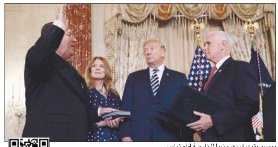
بومبيو يؤدي اليمين وزيراً للخارجية أمام ترامب

عام 1980. وكانت الرسالة التي أصدرتها حملة ترامب في ذلك الوقت قد أشارت إلى أن ترامب «يتمتع بصحة جسدية وقوة تحمل بدنية غير عادية». وقال بورنشتاين إن ترامب نفسه «هو الذي أملى تلك الرسالة، وأنا لم أكتبها»، رغم أنه أكد أنه أجرى لترامب فحصاً طبيًا كاملاً في ذلك الوقت «ولم يظهر إلا نتائج إيجابية». كما اتهم الطبيب السابق مقربين من الرئيس بأنهم «أغشروا» العام الماضي على عيادته وصادروا الملف الطبي للرئيس مستخدمين في «التعرض للاغتصاب والترويع وبالحزن». وأكد أنه تعرف إلى اثنين من الرجال الثلاثة هما كيث شيلر الحارس الشخصي لترامب وآلان غارتن المحامي في مجموعة القانونيّة، كشفت صحيفة «واشنطن بوست» في تقرير لها ان المحقق روبرت مولر الذي كلف بمهمة التحقيق في علاقة روسيا بالانتخابات الرئاسية الأخيرة، هدد باستدعاء الرئيس الأميركي دونالد ترامب للمثول أمام هيئة محلفين للإدلاء بأقواله، إذا رفض التحدث مع المحققين فيما يتعلق بالتحقيق الخاص بروسيا.