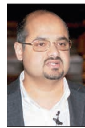
ممثل الشركة الأميركية متحدماً أمام الحضور