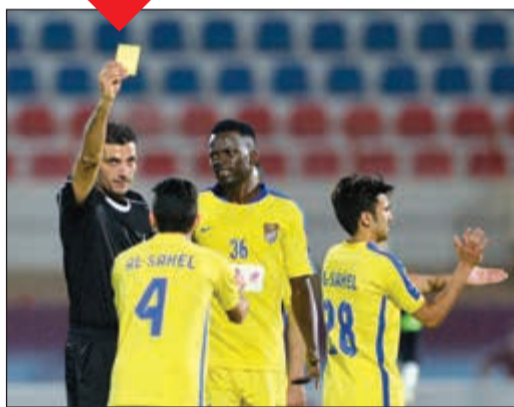
الشطب الجماعي ينتظر لاعبي الساحل