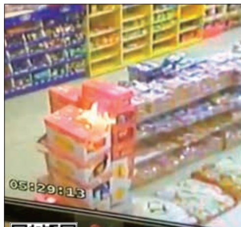
النيران تشتعل في كارتون الشيبسي