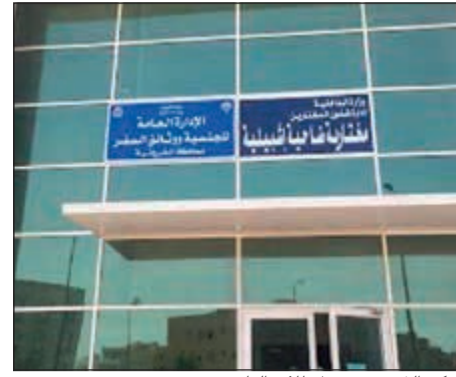
المركز الذي تعرض لإطلاق النار