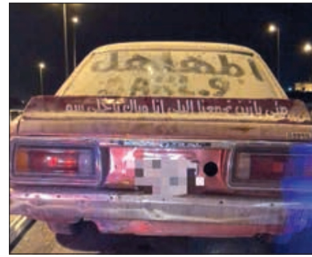
سيارة مخالفة في طريقها لكراج الحجز