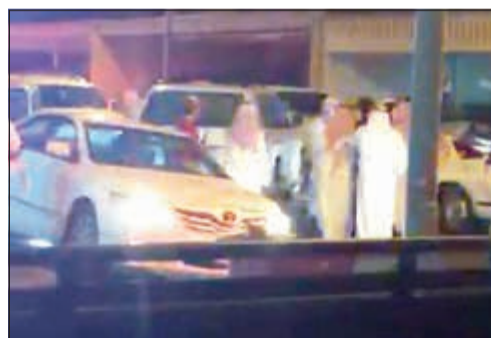
صورة أرشيفية من واقعة الاعتداء على رجال الأمن

اجتماعاً موسعاً ضم عدداً من وكلاء مساعدين .