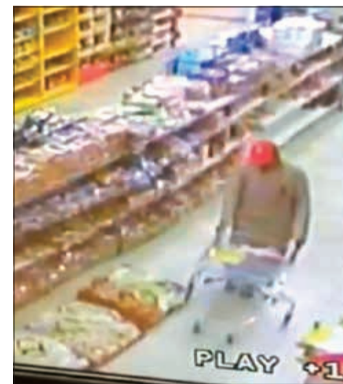
المواطن كما صورته كاميرا الجمعية

تمكن رجال الإدارة العامة للمباحث الجنائية يوم أمس من إغلاق قضية إقدام مواطن على اضرار الحريق عمداً داخل جمعية صباح الاحمد السكنية، حينما اضرم النيران في صندوق شيبسي وهرب الى جهة غير معلومة.