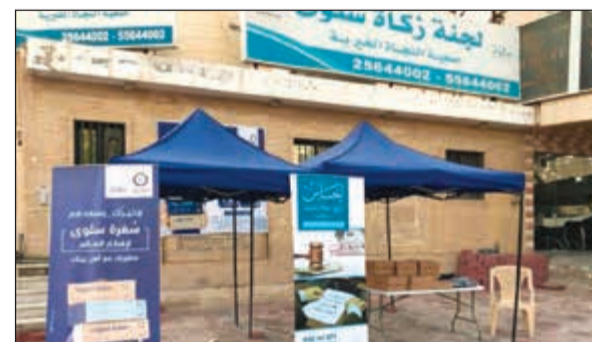
مشروع السفرة يحفظ كرامة الأسر