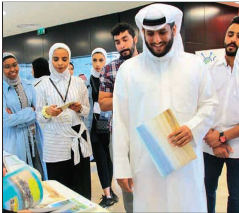
جانب من احتفالية «يوم الأرض»

في إطار برنامجه المجتمعي الهادف إلى دعم مختلف الفعاليات الشبابية والبيئية، قام بنك الكويت الدولي (KIB) مؤخراً برعاية احتفالية يوم الأرض العالمي التي نظمتها نادي O2 الجامعي التابع لقسم إدارة التقنية البيئية في كلية العلوم الحيائية بجامعة الكويت وذلك في حديقة الشهيد بهدف نشر التوعية بضرورة المحافظة على البيئة والأرض.