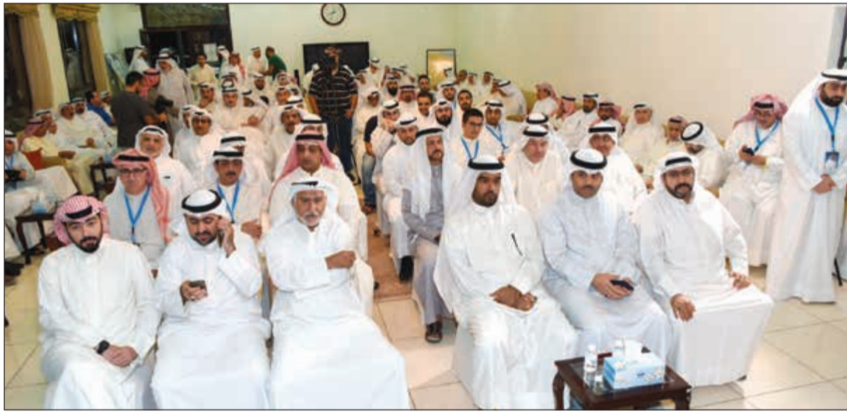
جانب من الحضور في المقر الانتخابي