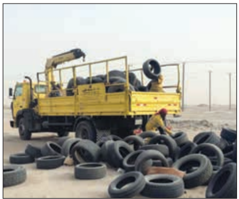
جانب من رفع الإطارات المهملة في الفروانية