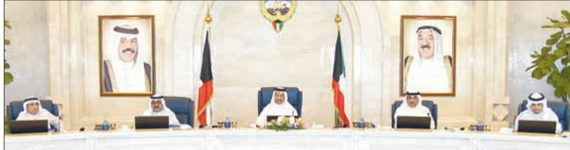
سمو الشيخ جابر المبارك مقرئاً جلسة مجلس الوزراء أمس بحضور الشيخ ناصر صباح الأحمد والشيخ خالد الخالد والشيخ خالد الجراح وأنس الصالح

2,9 مليون دينار أرباح «وربة» في الربع الأول.. بنمو 115% 24