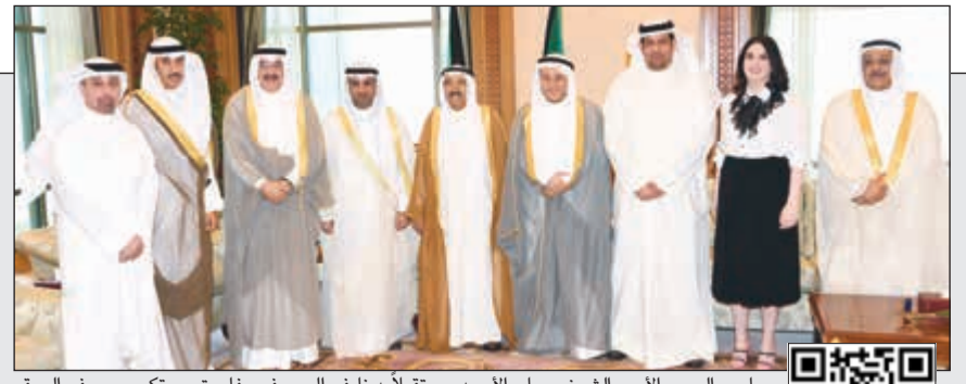
صاحب السمو الأمير الشيخ صباح الأحمد مستقبلاً دنايف الجحرف وفاروق بستكي ويوسف الصفر وأعضاء مجلس إدارة الخطوط الجوية الكويتية

يمكن استخدام QR كود أو لمشاهدة الفيديو أو تطبيق Zappar