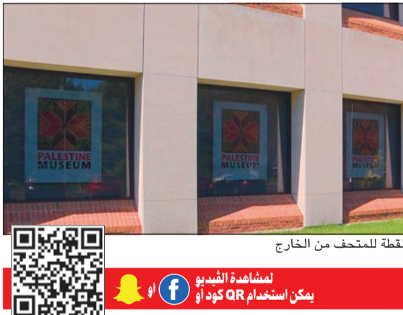
لقطة للمتحف من الخارج