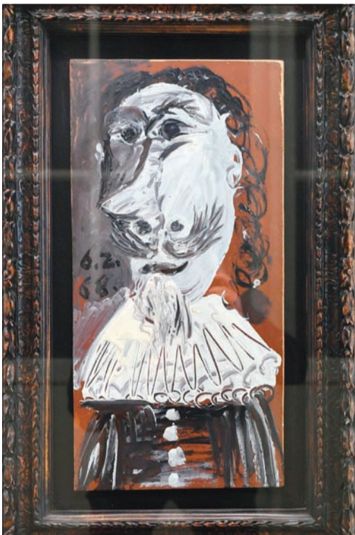
التمن الإجمالي للوحة مليوناً فرانك

جينف - أ.ف.ب: اشترى 25 ألفاً من رواد الإنترنت عبر منصة سويسرية لوحة ليكاسو لن يتمكنوا من تعليقها في منزلهم، إلا أنهم في وسعهم تأملها للمرة الأولى مع عرضها في جينف.