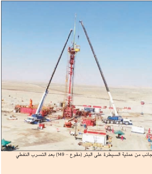
جانب من عملية السيطرة على البئر (مقوع - 149) بعد التسرب النفطي

أعلنت شركة نفط الكويت السيطرة على البئر (مقوع - 149) بعد التسرب النفطي الذي وقع فجر الاثنين الماضي في منطقة المقوع وأدى إلى نشوب حريق على بعد 750 متراً من موقع التسرب.