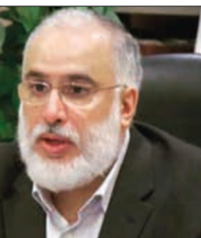
المخرج عبدالله عبدالرسول

فيها نجوم المسرح والدراما التلفزيونية، وعلى رأسهم طارق العلي وخالد أمين وسماح وأحمد إيراد وحمد العماني، ويعقوب عبدالله ومحمد الحملي، وحمد اشكنازي ومحمد الرضمان وعبدالحسن العمر وعبدالله البلوشي وبدر الشعبي وراوية وعلي الحسيني وأحمد العوضي وبدر البلوشي، ومجموعة كبيرة من فنانى المسرح والدراما التلفزيونية،