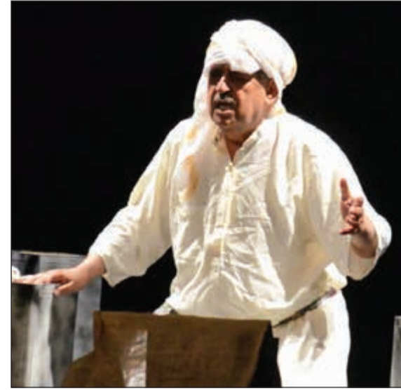
الفنان القدير صالح المناعي في مسرحية «سقاى الماي»