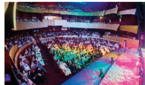
إقبال جماهيري غير مسبوق