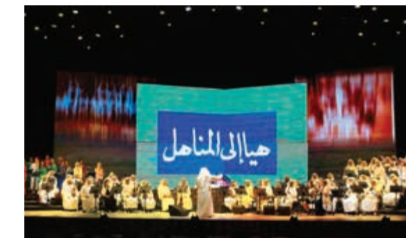
عزف مقدمة البرنامج التعليمي «هيا إلى المناهل»