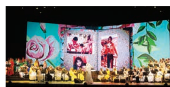
فكرة «يا أبونا وأمنا»