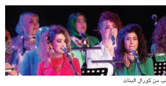
جانبا من كورال البنات