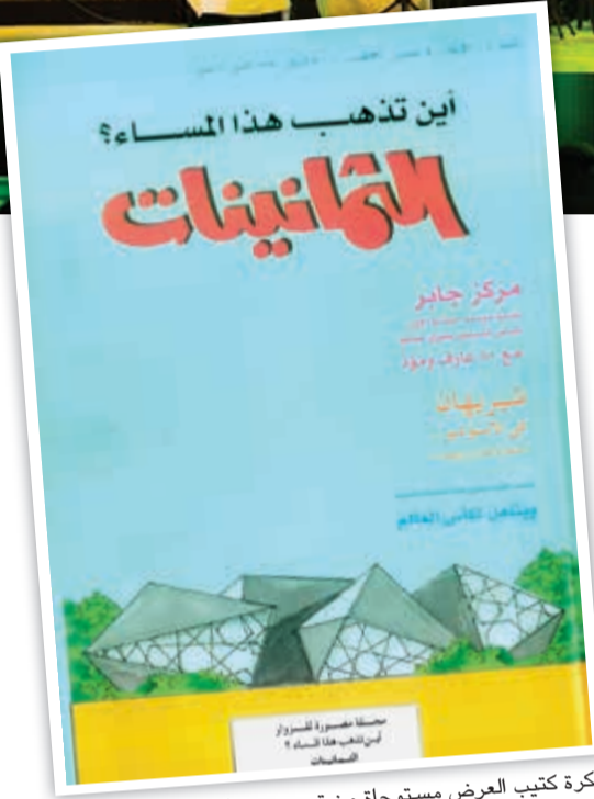
فكرة كتيب العرض مستوحاة من تصميم مجلات الثمانينات

بجرعة كبيرة من المتعة والغفوية والمرح. بين الجمهور الحاضر في الأمسيات الأربعة من كان يصفق للعرض، ومن كان يصفق لحفلة تذكياته الخاصة الموازية للعرض في ليلة أمطرت جمالا وحنينا وحبيا للكويت التي كانت - وأثبت العرض أنها لا تزال - مصنع المبدعين ومنازة المنطقة. من طبيعة الزمن عدم القدرة على الاحتفاظ به، وأنه يُعاش مرة واحدة فقط.. لكن للفن دائما رؤى وحلول أخرى تجعل المستحيل ممكنا وتستخلص من القديم أجمل جديد.. وهكذا كان!