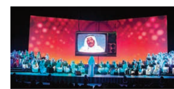
الإعلامي المخضرم عبدالرحمن النجار ونكريات «شبكة التلفزيون»