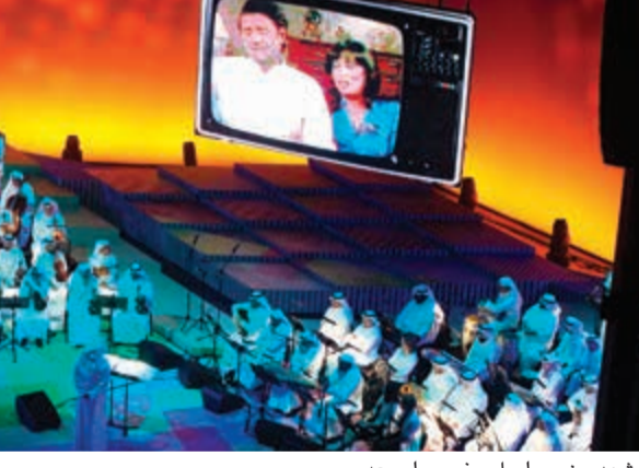
مشهد من مسلسل «خرج ولم يعد»