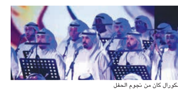
الكورال كان من نجوم الحفل