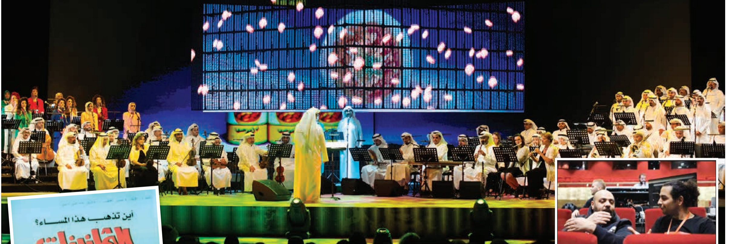
إحدى فقرات العرض التي أعادت إحياء إعلان «قول ريتا» الذي اشتهر في الثمانينات