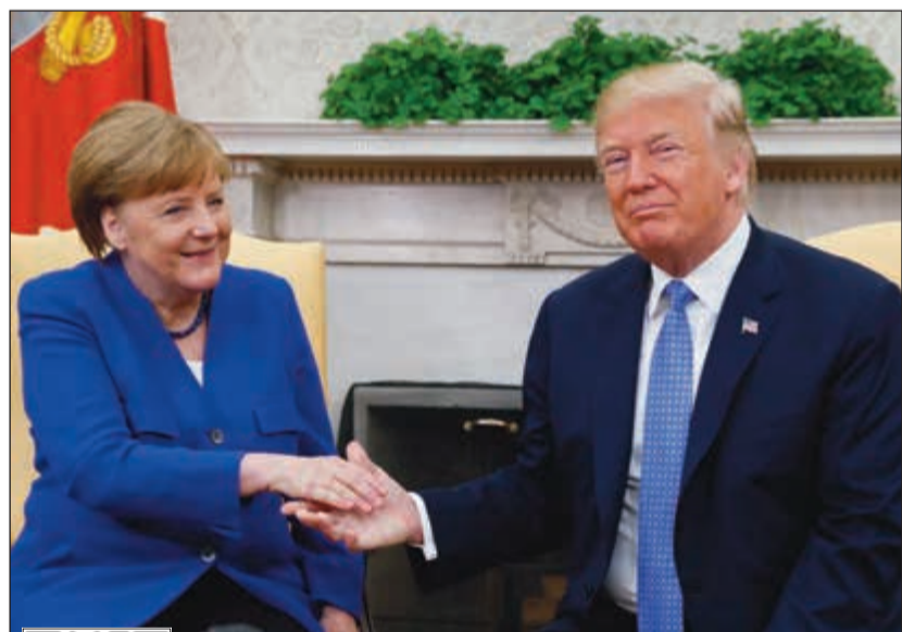
ترامب وميركل يتصافحان قبل محادثتهما في البيت الأبيض أمس