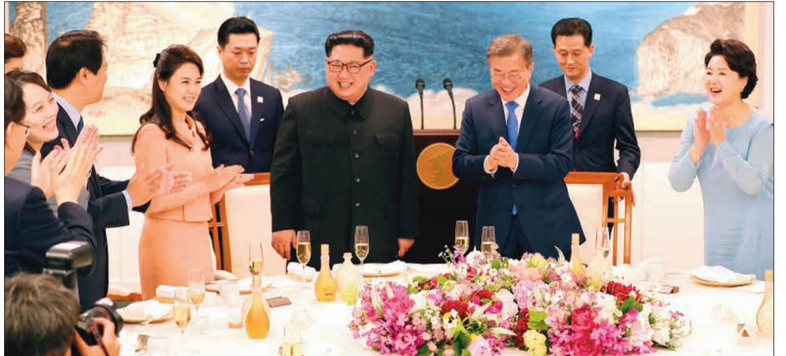
زعيم الكوريتين وزوجتهما خلال قمتها التاريخية في المنطقة منزوعة السلاح أمس