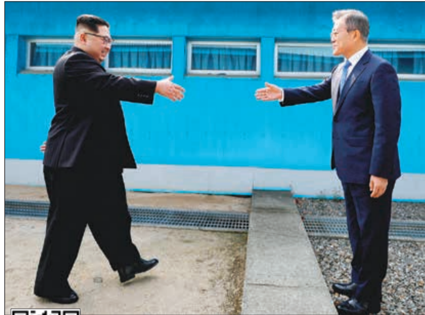
زعيم الكوريتين لحظة تجاوزهما الخط الفاصل