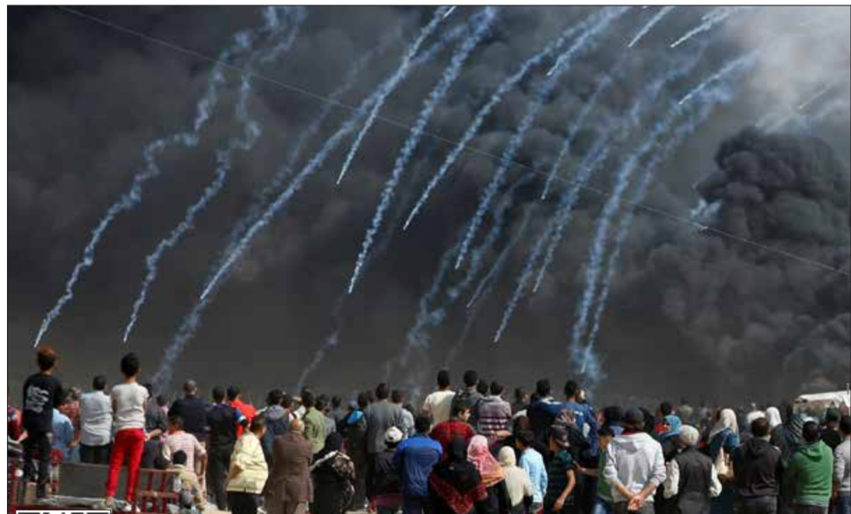
قوات الاحتلال تطلق قنابل الغاز باتجاه المتظاهرين الفلسطينيين في مظاهرة «الشباب الثائر»

عواصم - وكالات: تجددت اعتداءات الاحتلال الإسرائيلي على مئات الفلسطينيين المدنيين الذين شاركوا في الأسبوع الخامس من «مسيرات العودة» السلمية على حدود قطاع غزة مع إسرائيل.