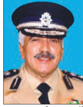
الفريق محمود الدوسري

قائدوها بالاستهتار والرعونة عقب نزول المطر يوم أمس الأول وتم حجز المركبات التي حاول قائدوها الهروب من الدوريات التي قادها اللواء علي ماضي والعميد عبدالله سفاح حيث أسفرت الحملة عن تحرير 77 مخالفة مرورية وأردف المصدر بأن دوريات الأمن العام ستستمر في جميع محافظات البلاد للتصدي للقائدي المركبات المخالفة للقانون وتعريض حياة الآخرين للخطر.