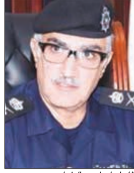
اللواء إبراهيم الطراح

ان الإدارة العامة للمرور قامت بتنفيذ خطة الطوارئ المعدة لمثل هذه الأحداث وذلك بانتشار الدوريات المرورية على كل الطرق