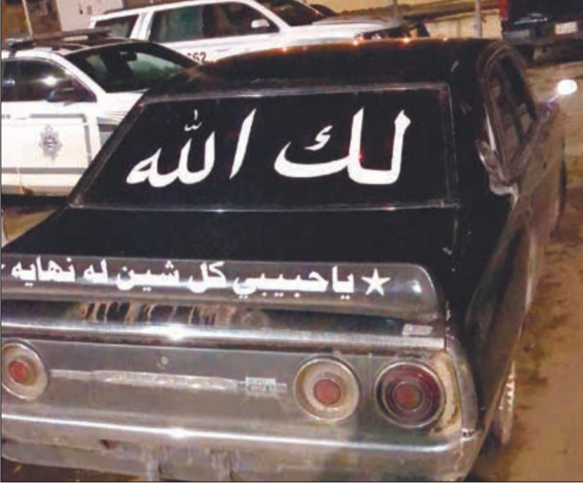
مركبة أحد المستهترين في طريقها إلى الحجز

الخمس من تقلبات جوية، مشيرة إلى أن أجهزة الأمن ضبطت 65 مستهترا خلال ممارسة الرعونة والاستهتار في أنحاء متفرقة من البلاد.