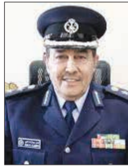
العميد خليل الأمير

فرق الإطفاء وهي عبارة عن سقوط بعض الأشجار في الطرق العامة وسقوط مظلات للسيارات وحرائق كيبيل أرضي للكهرباء وحرائق منازل، وأضاف أن جميع هذه الحوادث لم ينتج عنها أي خسائر بشرية إنما كانت أضرارها مادية فقط. وشدد العميد خليل الأمير على أن خطة الطوارئ التي تتبعها الإدارة العامة للإطفاء