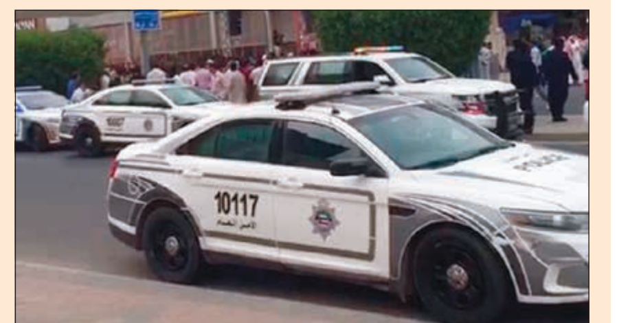
دوريات الامن العام حضرت لتأمين الموق