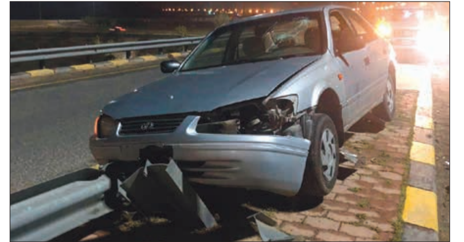
المركبة بعد اصطدامها بالحاجز الفاصل بين الطريقين