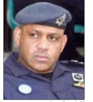
اللواء صالح مطر

أحال رجال دوريات سرية المهام إلى الإدارة العامة للتفتيش مواطنة مطلوبة بمبلغ 11 ألف دينار لعدد من الشركات وبـ 4 ملفات مختلفة وتم رفع تقرير رجال دوريات امن الفروانية من إلقاء القبض على مواطن في منطقة الرقعي، حيث تبين أنه مطلوب بمبلغ 81 ألف دينار وأمر اللواء ركن صالح مطر بإحالة الشخص إلى جهة الاختصاص.