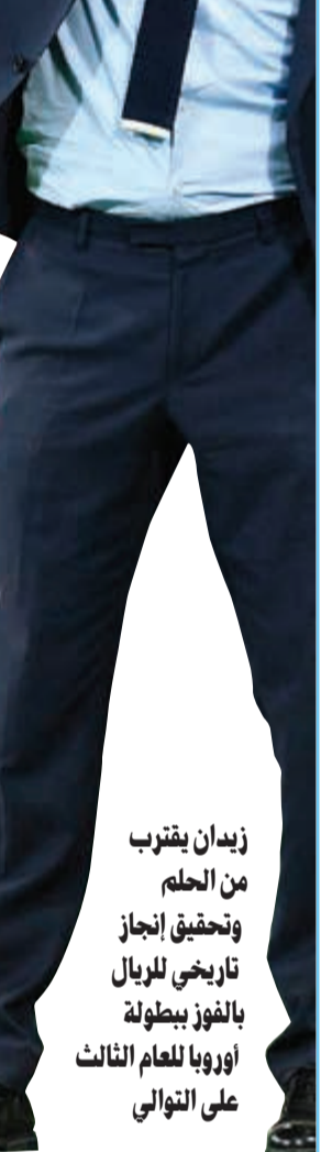
زيدان يقرب من الحلم وتحقق إنجاز تاريخي للريال بالفوز ببطولة أوروبا للعام الثالث على التوالي

اقترح ريال مدريد الإسباني حامل اللقب في النسختين الأخيرتين من النهائي الثالث على التوالي بعد أن جدد فوزه على بايرن ميونخ الألماني 2-1 على ملعب «البايز آرينا» في ميونخ في ذهاب نصف نهائي دوري أبطال أوروبا لكرة القدم. وسجل لبايرن جوشوا كيميشتش (28)، ولريال البرازيلي مارسيلو (44) وماركو اسينسيو (57). وتقام مباراة الإياب على ملعب «سانتياغو برنابيو» في مدريد الثلاثاء المقبل. وكان ليفر بول اكتسح ضيفه روما الإيطالي 5-2 الثلاثاء في ذهاب المواجهة نصف النهائية الأولى، ويلتقيان أياها الأربعاء المقبل في روما. وتقام المباراة النهائية للبطولة في 26 مايو في كييف. وتفوق الملكي على بايرن ميونخ بالنتيجة ذاتها في ميونخ أيضاً في