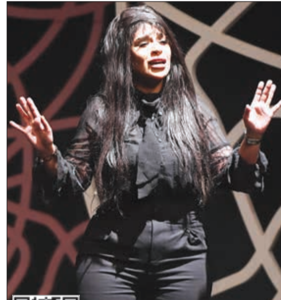
حصة النبهان في عرض مونودراما نال إعجاب الجميع

تحت رعاية وزير الإعلام ووزير الدولة لشؤون الشباب محمد ناصر الجبري وبحضور الأمين العام المساعد لقطاع الفنون في المجلس الوطني للثقافة والفنون والآداب د.بدر فيصل الدويش ورئيس جمعية الفنانين الكويتيين الفنان القدير عبدالعزيز المخرج «شادي الخليج»، والفنانة القديرة هيفاء عادل ونخبة من نجوم الكويت والخليج في المسرح، افتتحت امس الأول الدورة الخامسة لمهرجان الكويت الدولي للمونودراما التي تحمل اسم الفنان القدير جاسم النبهان تقديرا وعرفانا لما قدمه للمساحة الفنية الكويتية والخليجية والعربية وذلك على خشبة مسرح الدسمه. انطلق حفل الافتتاح بجولة في المعرض الفني