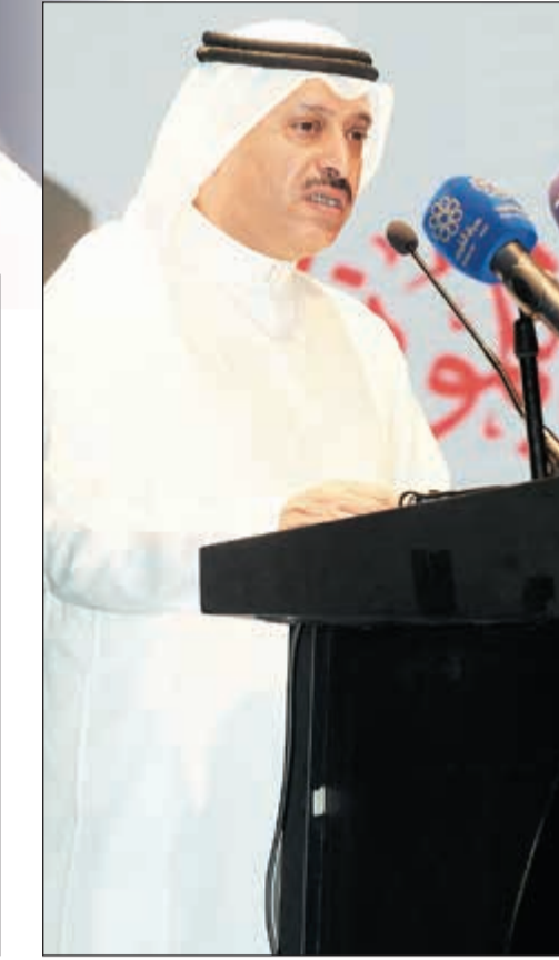
كلمة ضيوف المهرجان القاها الكاتب السعودي فهد الحارثي