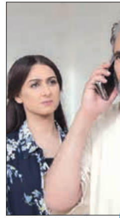
هيفاء والقحطاني في المسلسل