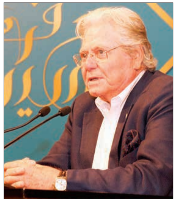
حسين فهمي يحكي قصة نجاحه

أيام جده في الديوان الملكي وصولاً إلى مرحلة الشباب وانتقاله إلى الولايات المتحدة الأميركية ودراسته الإخراج، شارحاً كيف تمكن من الاستفادة من الإخراج في أعماله الفنية التي امتلك فيها عين المخرج والممثل.