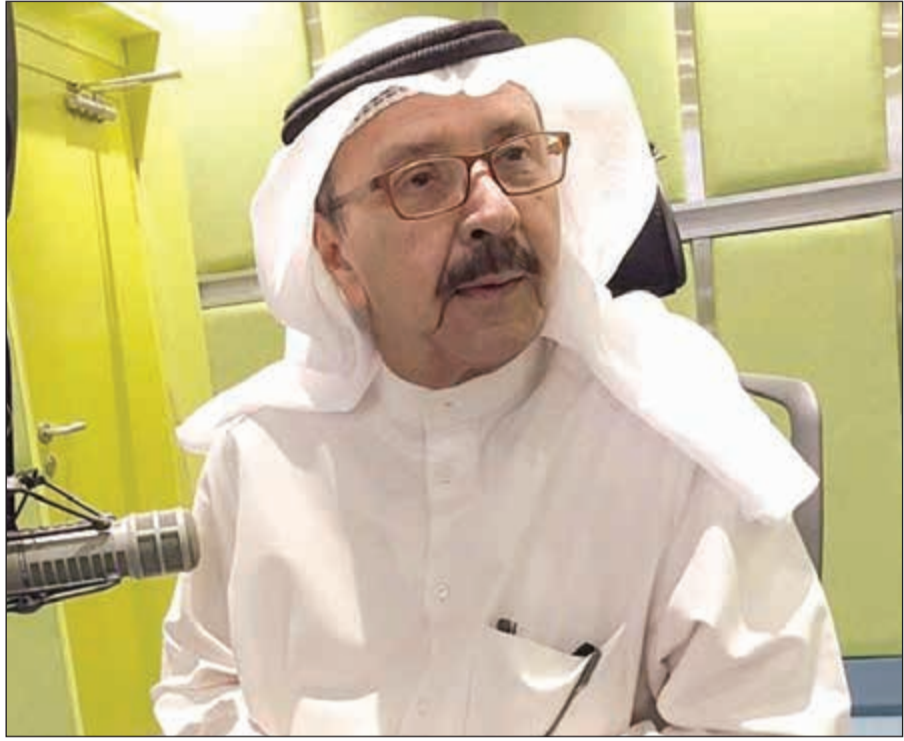
الإعلامي القدير ماجد الشطي

وراء إطلاق الشائعات عن زملائهم، أجاب: في الوسط الإعلامي والفني وفي المجالات الأخرى توجد حروب، ويخطئ من يعتقد أنه محبوب من كل الناس، لأنه لا بد أن يوجد من يكرهه ويحسد ويحقد، وهذه شئنة الحياة، مؤكداً أنه لم يفكر أبداً في اللجوء إلى القضاء لرد على هؤلاء.