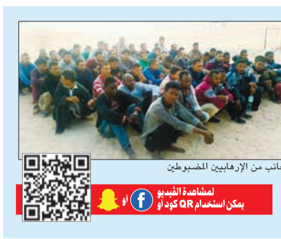
جانب من الإرهابيين المخطوبين