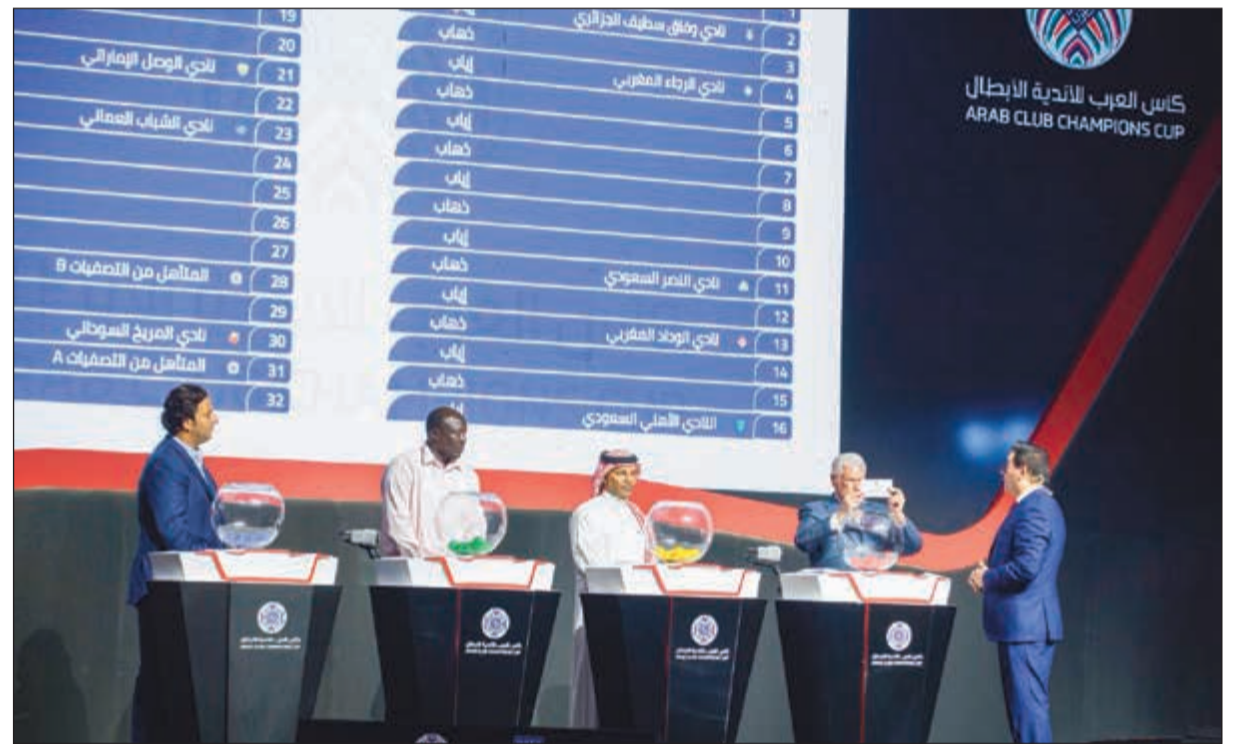
مجموعة من النجوم شاركوا في سحب القرعة

والأهلي المصري مع المتاهل من التصفيات A، والأهلي السعودي مع المحرق البحريني. يذكر أن البطولة ستقام في شهر أغسطس المقبل، على أن يتم تحديد المواعيد بصفة رسمية خلال الأيام المقبلة، علماً بأن صاحب المركز الأول سيحصل على 6 ملايين دولار، فيما ينال الوصيف مليونين ونصف المليون.