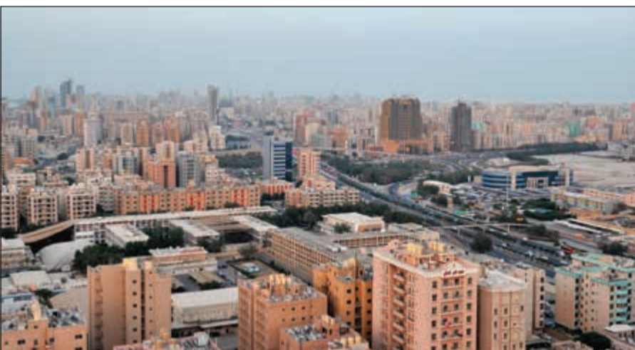
ارتفاع مبيعات العقارات السكنية في الكويت مطلع العام (زين علام)

النتائج المحلي الإجمالي غير النفطي 3,5٪ و 4٪ هذا العام للعام المقبل على التوالي. ويرغم ما تشهده قيمة مبيعات العقارات السكنية واعدائها من ارتفاع، فقد توقعت المجموعة أن يتعرض سوق الإيجارات في الكويت لضغوط متجددة في عام 2018 بسبب إستراتيجية الكويت، التي - وأن كانت تستهدف القطاع العام إلى حد كبير - إلا أن بعض شرائح القطاع الخاص تعرضت لضغوط من أجل تقليص مستويات العمالة الوافدة لديها.