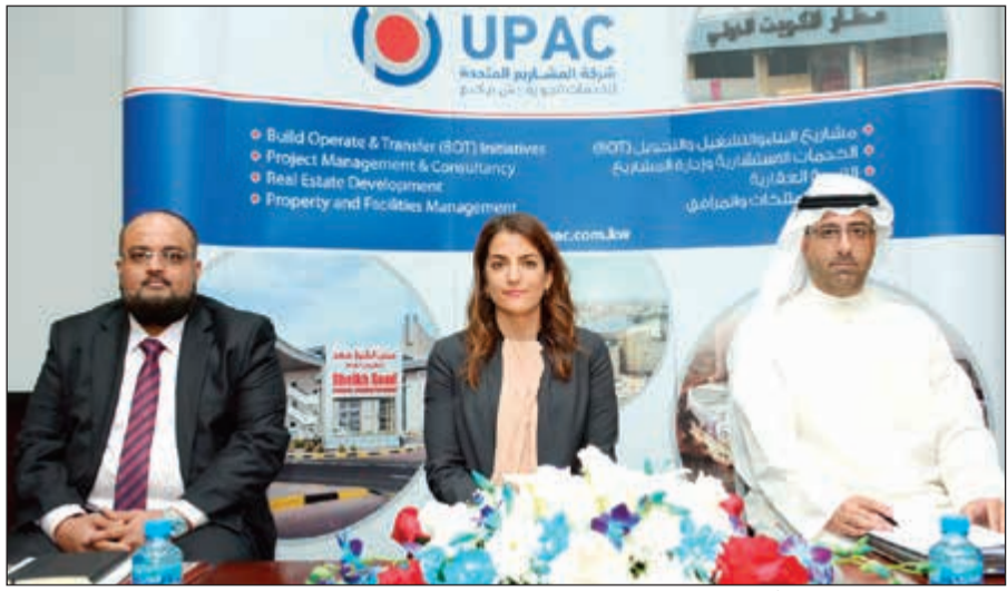
جانب من عمومية «يوباك» أمس