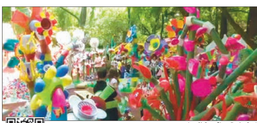
كل مكونات الحديقة من البلاستيك

فكرة مبتكرة توصل إليها فنان دنماركي لتشجيع الناس على الحفاظ على البيئة وإعادة تدوير المخلفات هي صنع حديقة نباتات من المخلفات البلاستيكية. وقضى عشرات المتطوعين ساعات في جمع الزجاجات البلاستيكية من المطاعم والمتاجر ومكبات القمامة قبل غسلها وإعادة تشكيلها لبث الحياة في الغابة التي جاءت من وحي خيال توماس دامبو. وتضم الحديقة المفعمة بالألوان خمس زهور كبيرة وأشجاراً ضخمة تحيط بها آلاف الزهور الصغيرة ونماذج لجموع من الحيوانات، جميعها مصنوعة من البلاستيك. واطلق دامبو على حديقته اسم «غابة المستقبل» لأنها تبدو مبهجة من الخارج لكن عند اللمح النظر فيها سيخيل الناس كيف ستكون حياتهم في المستقبل إذا ظلوا يلقون بالمخلفات البلاستيكية وتآخر ذلك على البيئة. وقال دامبو عن الحديقة: «أمل أنه عندما يأتي الناس ويشاهدون الحديقة ويرون