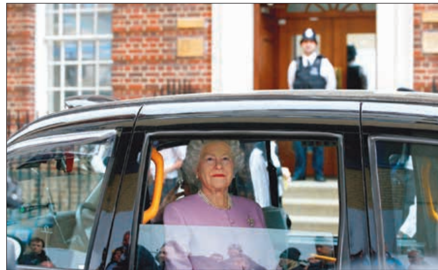
تمثال من الشمع الملكة بريطانيا إليزابيث الثانية في توكسي أمام مستشفى سانت ماري

أنجبت كايت، زوجة الأمير البريطاني وليام، صبيًا الإثني، هو ثالث أطفالهما، بحسب ما أعلن قصر كنسينغتون. وجاء في بيان صادر عن القصر أن «صاحبة السمو الملكي دوقة كامبريدج أنجبت بلا تعقيدات صبيًا عند الساعة 11,01»، مع الإشارة إلى أن المولود الذي سيكشف عن اسمه «في الوقت المناسب» يزن 3,8 كيلوغرامات. ويحصل هذا الطفل لقب صاحب السمو الملكي، فضلًا عن لقب أمير كامبريدج، كما شقيقه البكر. وهو الخامس في ترتيب خلافة العرش البريطاني، بعد جده تشارلز، أمير ويلز، ووالده الأمير وليام وشقيقته الأميرة شارلوت. وللمرة الأولى في تاريخ النظام الملكي البريطاني، لا يتقدم هذا الصبي على