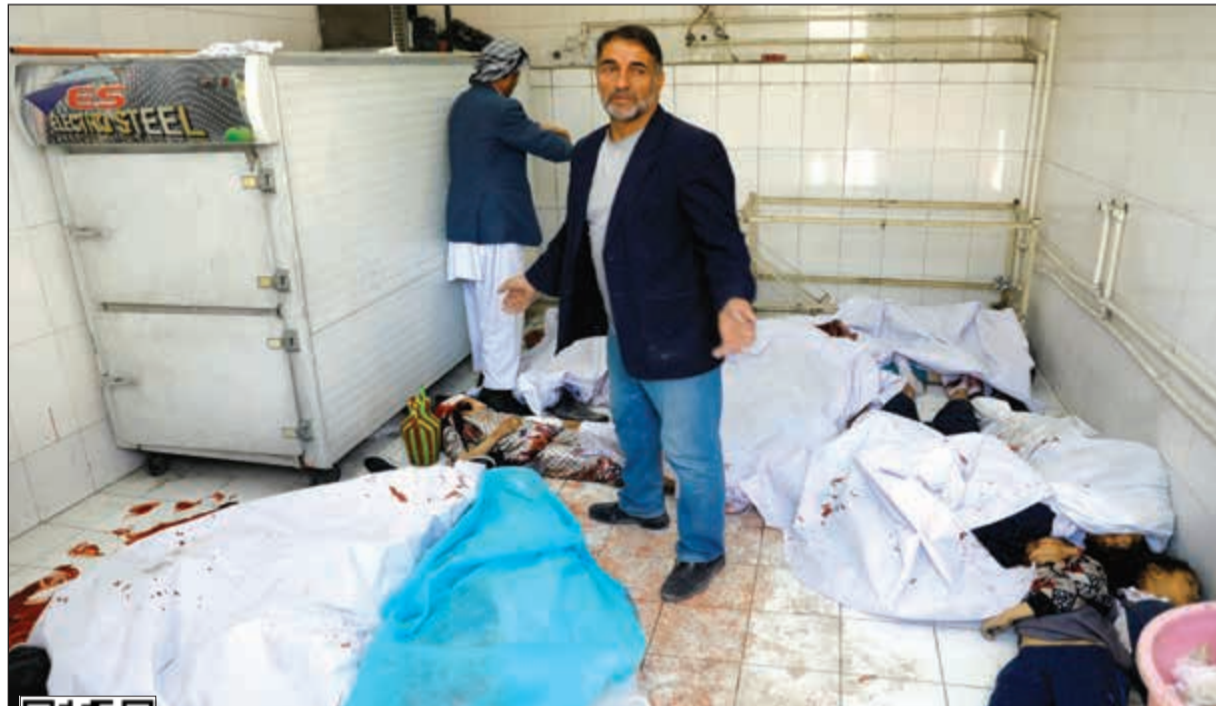
جثث الضحايا في مستشفى كابول عقب نقلها من مكان التفجير الانتحاري امس