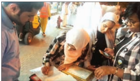
تحرير إحدى المخالفات