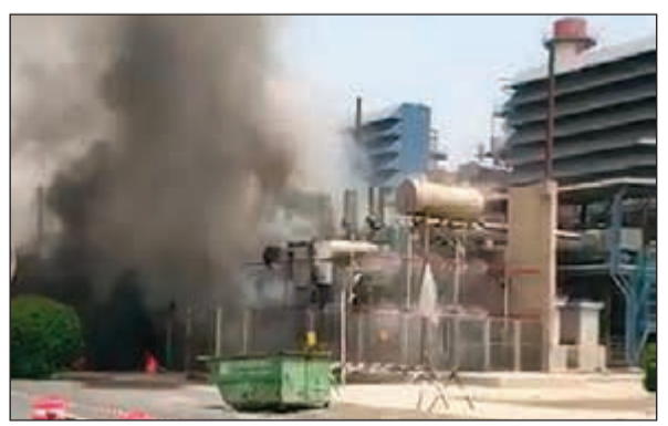
جانب من حريق الزور