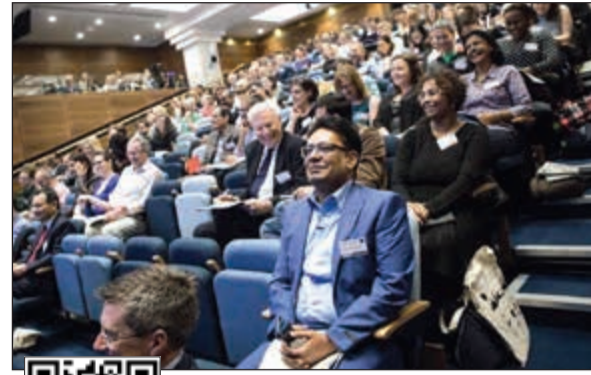
من الحضور في المؤتمر