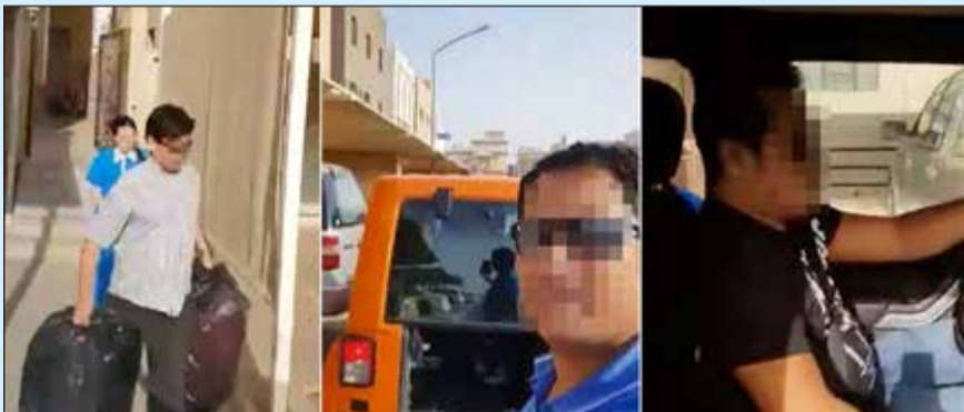
المتورطون الثلاثة كشفهم الفيديو الأخير

■ المضبوطون اعترفوا بأنهم ضمن فريق مكون من 9 أشخاص حضروا إلى البلاد قبل شهر وتلقوا أوامر بسرعة المغادرة بعد انتشار الفيديوها.. لكنهم وقعوا في قبضة الأمن