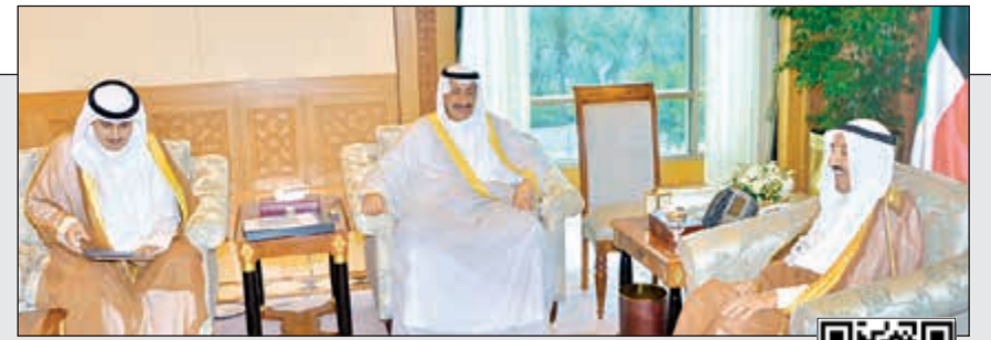
صاحب السمو الأمير الشيخ صباح الأحمد مستقبلاً م. حسام الرومي وم. أحمد المنفوشي