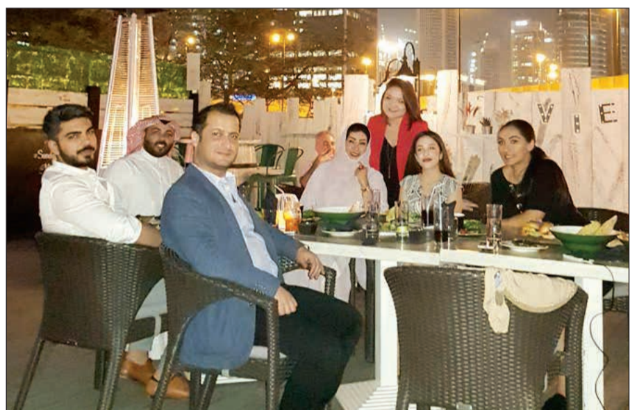
الوفد الإعلامي واستراحة خفيفة