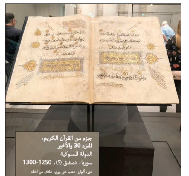
جزء من القرآن الكريم، الجزء 30 والأخير الدولة للملوكية سوريا، دمشق (9)، 1250-1300 حجر، أوان، ذهب على ورق، غلاف من الخلد الورق أبو ظبي