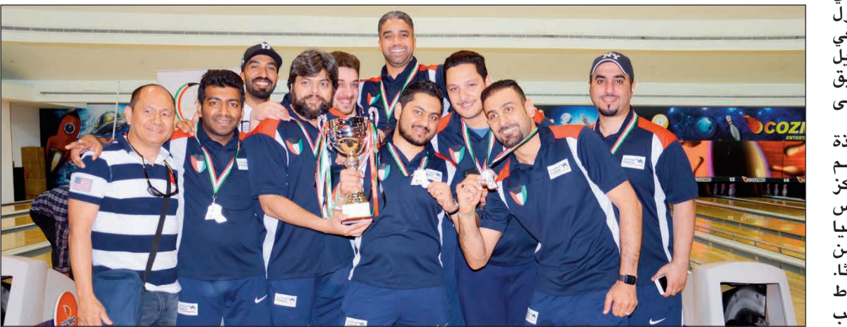
بنك الكويت الوطني... وكأس المركز الثاني