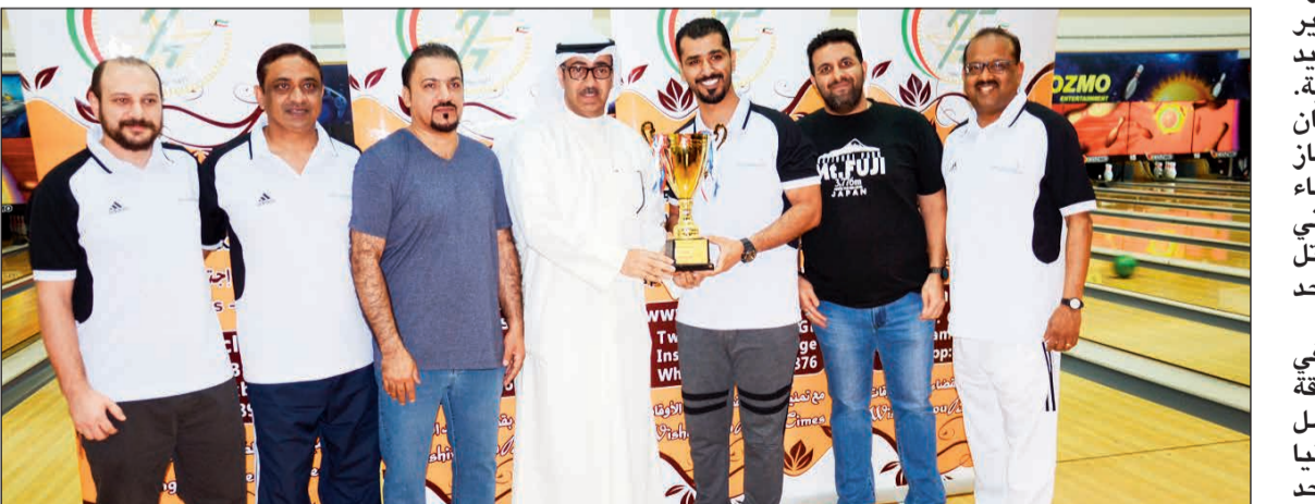
المندي مكرما «الأهلي المتحد»

وحصل فريق البنك الأهلي المتحد على أعلى شوط فرق في البطولة.