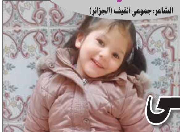
الشاعر: جموعي انثيف (الجزائري)