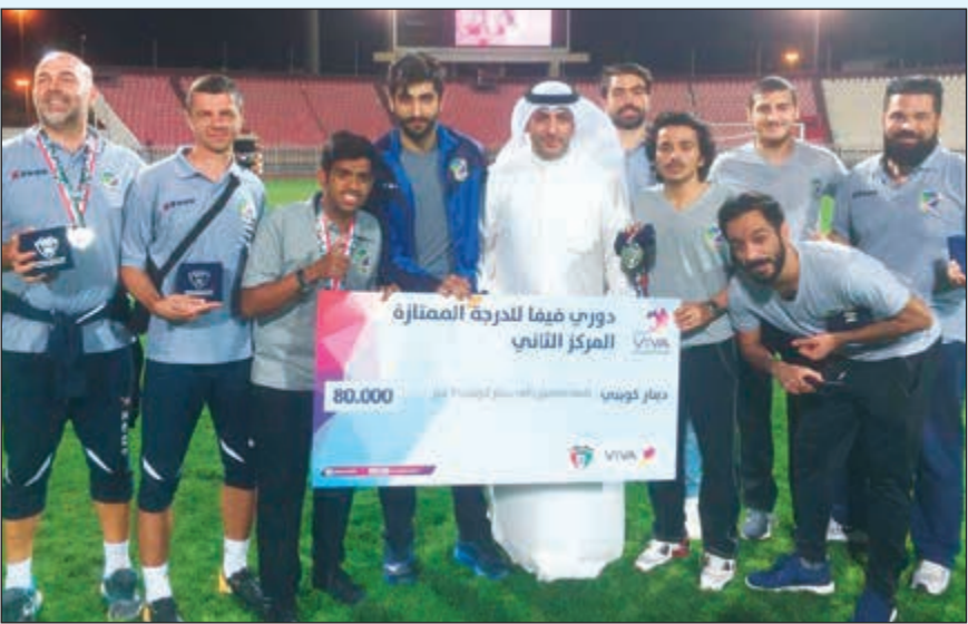
لاعب السالمية سعداء بجائزة المركز الثاني والميداليات الفضية

المركز السابع، في حين بقي السالمية على رصيده السابق بـ 33 نقطة بعدما أصبح رصيده 26 نقطة في عن القادسية.