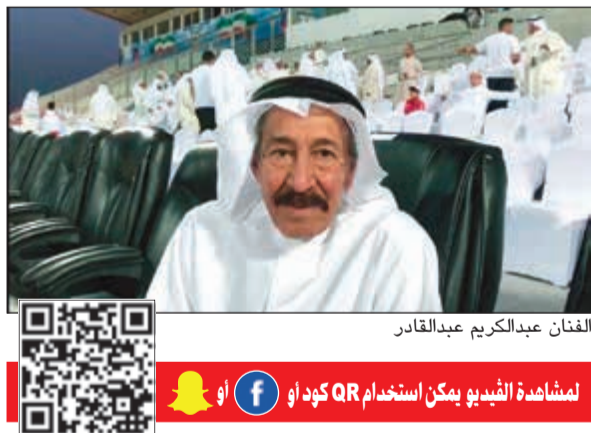
الفنان عبدالكريم عبدالقادر