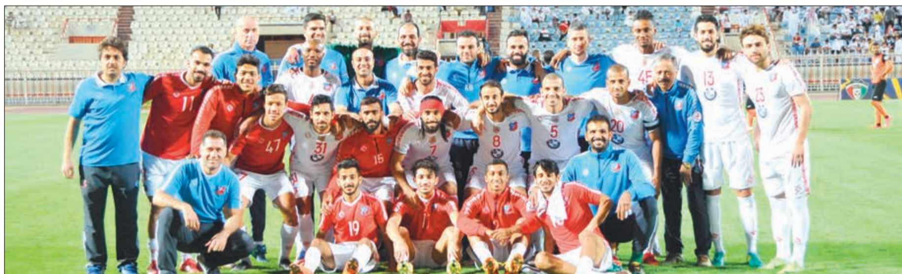
لاعب الكويت قبل انطلاق اللقاء