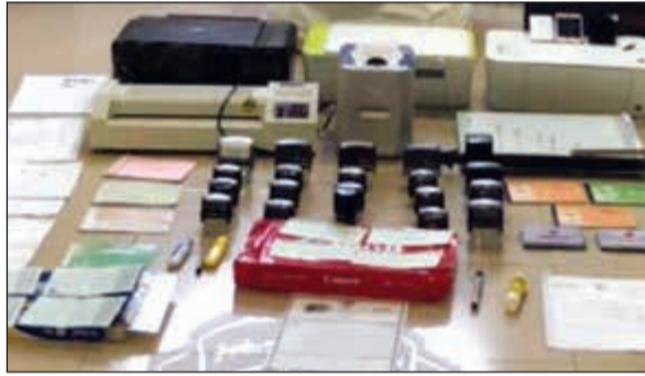
المضبوطات تنوعت بين معاملات وأختام وأجهزة تستخدم في التزوير