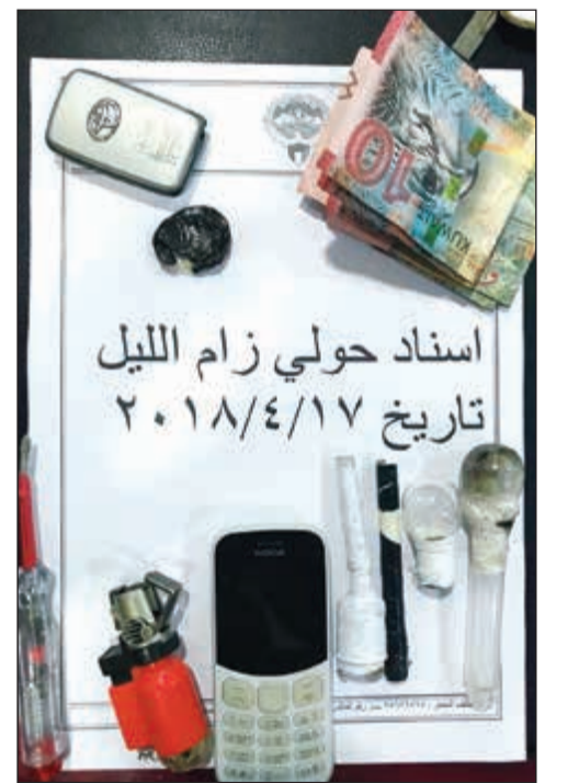
من المواد المخدرة المضبوطة

من جهة أخرى، ألقى رجال سرية المهام الخاصة القبض على مواطن من مواليد 1985 وبدون مواليد 1986، وعثر بحوزتهما على كبس كيميكا، وآخر به شبو وأحيل إلى المكافحة.