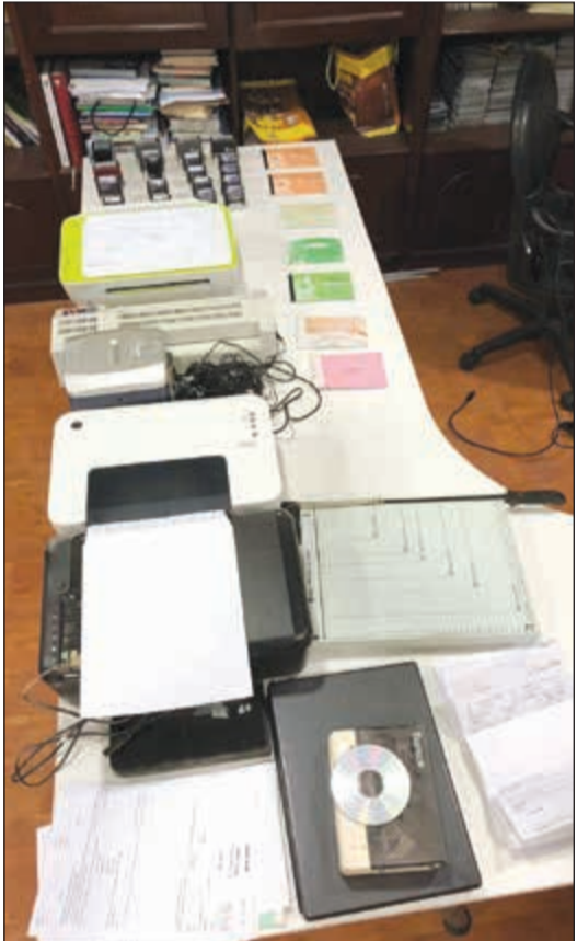
جانب من المضبوطات التي عثر عليها في منزل المتهم