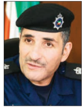
اللواء طلال معرفي

وأيا الذين دخلوا قبل هذا التاريخ بموجب سمة دخول سواء للزيارة أو الإقامة أو للتردد أو المرور وانتهت المدة القانونية لبقيتهم في البلاد، وطلبت الإدارة المخالفين إلى الاستفادة من مزايا البادرة الإنسانية وتعديل أوضاعهم وأوضاع أسرهم، مؤكدة أن أبواب الإدارات العامة لشؤون الإقامة مفتوحة طوال ساعات الدوام وعلى مدار الأسبوع لاستقبال المراجعين لإنجاز معاملاتهم، لافتة إلى أن هناك تعليمات لمديري وموظفي الإدارات بسرعة إنجاز المعاملات وتسهيل الإجراءات وفق القواعد المحددة لكل حالة.