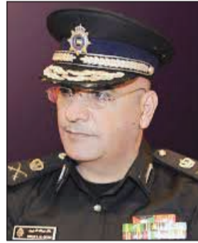
اللواء خالد الدين