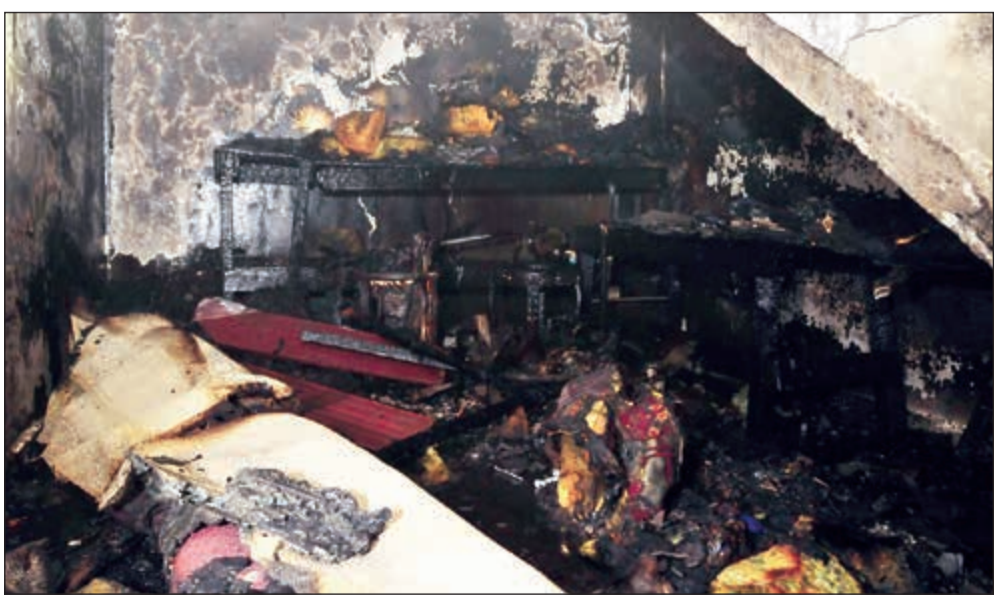
الحريق اتى على محتويات سرداب بمساحة 600 متر تقريبا