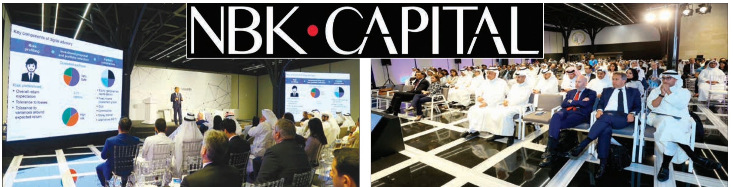
حضور كثيف لمتابعة أعمال المنتدى

البحر: ملتزمون بالاستثمار في تحسين الخدمات المالية للعملاء وتلبية احتياجاتهم