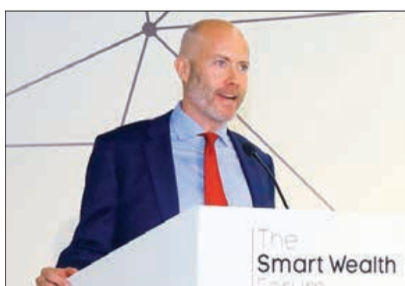
المحدث من دويتشه بنك

ونكر أنه بإمكان المستثمرين إدارة استثماراتهم ومراقبتها من خلال البوابة الإلكترونية لخدمة سمارة وبلت المقدمة من شركة الوطني للاستثمار، أو عن طريق تطبيق الهاتف النقال، مبيّنا أنه يمكن للمستثمرين تسجيل الدخول بسهولة للدخول إلى حسابهم وإدارته في أي وقت ومن أي مكان.