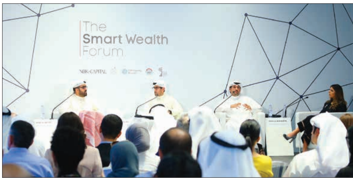
خلال الجلسة النقاشية