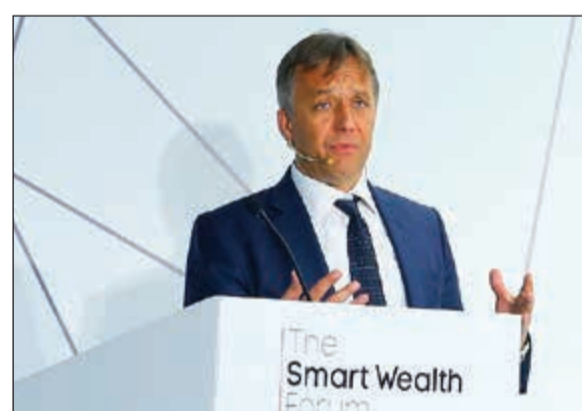
المحدث من شركة ماكنزي