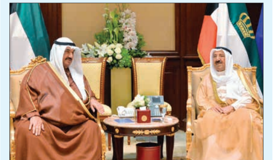
صاحب السمو الأمير مستقبلا سمو الشيخ ناصر المحمد

هذه الشعوب من أفكار وعادات وسبل حياة لا تعارض مع أحكام الدين والخصوصية الكويتية. وقد قامت الوزارة في سبيل إنجاح هذه الجائزة القيمة بوضع تصور متكامل لإقامة هذه المسابقة وكونت فرقا ولجانا ووضعت الأسلوب الأمثل في كيفية تحكيمها واختيار مجموعة أهل العلم والاختصاص والخبرة في القرآن وحفظه وتجويده من شتى أقطار العالم الإسلامي، كما تم وضع منهج للتحكيم يتميز بالدقة والعدالة والموضوعية حتى تخرج هذه الجائزة بالصورة اللائقة الحفل الكريم، إن مما تنعم به الكويت من أمن وأمان وازدهار واستقرار وتسامح وتعايش بين أهلها لهو بفضل الله ثم بفضل تمسك قيادتها الكريمة وعلى رأسها صاحب السمو الأمير بالقرآن باعتباره أهم مكون من مكونات الشخصية الكويتية التي عرفت بحبها للخير وتسامحها مع الآخر وتسليحها بقيم الوحدة الوطنية والتعايش السلمي والحوار الحضاري وإرساء قواعد العدل والقيم