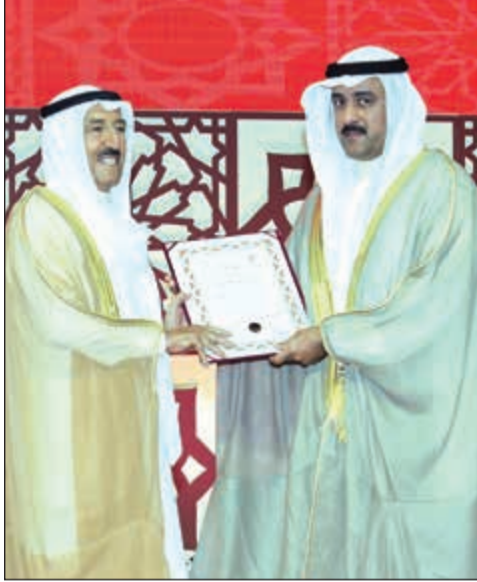
تكريم د. محمد منكار

سموه كان على رأس مودعي رئيس كوت ديفوار بالمطار صاحب السمو استقبل المحمد والمعجل وأمين الجميل ونورا جنبلاط