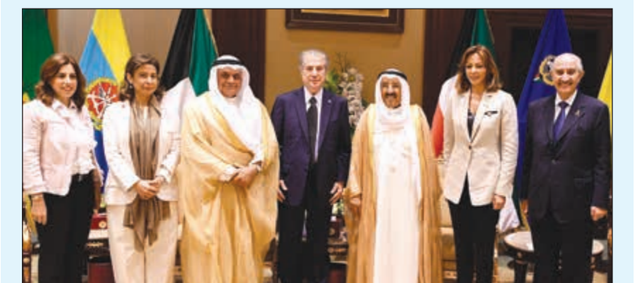
صاحب السمو الأمير الشيخ صباح الأحمد مستقبلا الرئيس أمين الجميل ونورا جنبلاط