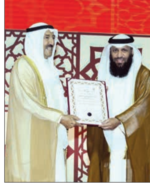
سمو الأمير مكرما داود العسوس