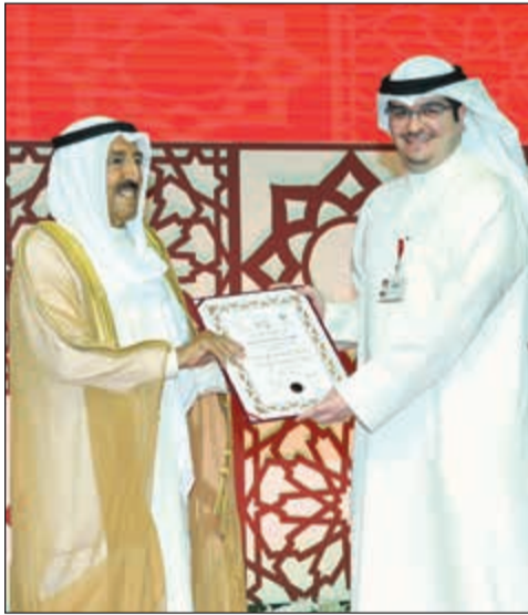
سمو الأمير مكرما م. نواف خالد المشري

بمناسبة انعقاد الحفل الخيري التاسع للمركز بالكويت. حضر المقابلات وزير شؤون الديوان الأميري بالإناية الشيخ محمد العبدالله. من جهة أخرى، غادر البلاد ظهر أمس الرئيس الحسن واتارا رئيس جمهورية الصديقة والوفد الرسمي المرافق له وذلك بعد زيارة رسمية للبلاد أجرى خلالها مباحثات رسمية مع صاحب السمو الأمير الشيخ صباح الأحمد. وكان على رأس مودعي رئيس كوت ديفوار صاحب السمو الأمير ورئيس مجلس الأمة مرزوق الغانم وسمو رئيس مجلس الوزراء الشيخ جابر المبارك وكبار المسؤولين بالدولة. استقبل صاحب السمو الأمير الشيخ صباح الأحمد بقصر بيان صباح أمس سمو الشيخ ناصر المحمد. كما استقبل صاحب السمو الأمير الشيخ صباح الأحمد بقصر بيان صباح أمس رئيس مجلس الوزراء الشيخ جابر المبارك. إلى ذلك، استقبل سموه بقصر بيان صباح أمس رئيس مجلس التعاون الخليجي التونسي فهد المعجل وأعضاء المجلس وذلك بمناسبة تشكيل المجلس. كما استقبل سموه بقصر بيان صباح أمس الرئيس أمين الجميل رئيس الجمهورية اللبنانية الأسبق ورئيس مجلس أمناء مركز سرطان الأطفال في لبنان نورا جنبلاط وذلك