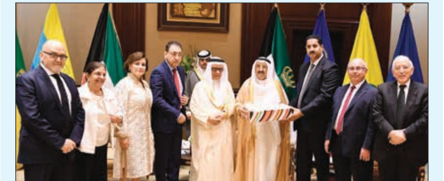
صاحب السمو الأمير مستقبلا رئيس مجلس التعاون الخليجي التونسي فهد المعجل وأعضاء المجلس