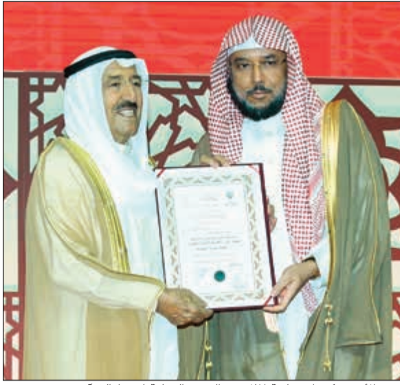
سمو الأمير مكرما مسابقة الملك عبدالعزيز الدولية لحفظ القرآن