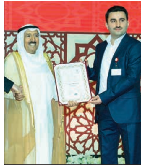
تكريم مؤسسة وقف الخيرات التركية لجهودها في خدمة القرآن