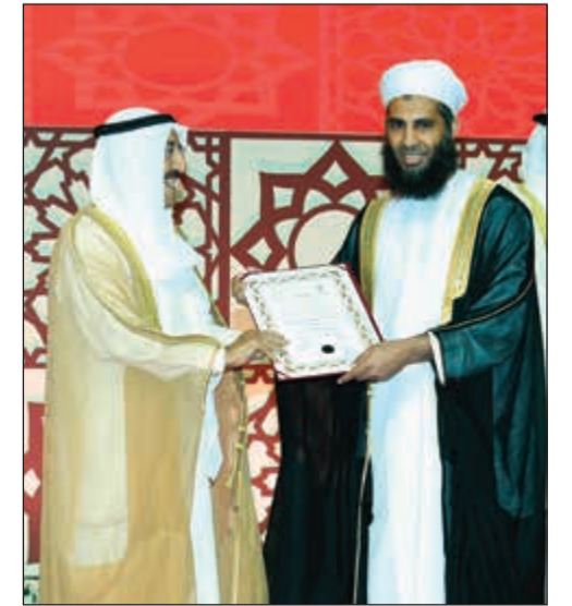
تكريم وزارة الأوقاف العمانية بجائزة أفضل موقع الكتروني بخدمة القرآن