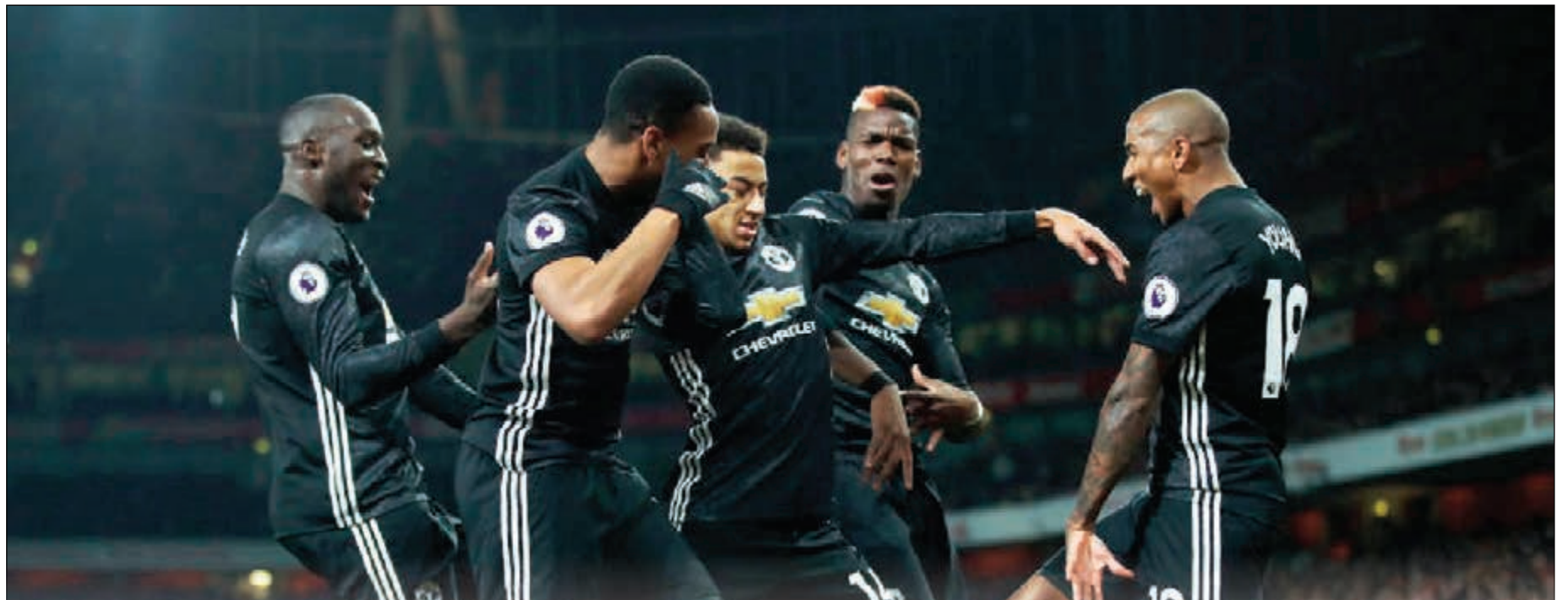
هل يصلح اليونانيد جماهيره؟

لا يزال الجدل مستمرا بشأن مستقبل نجم برشلونة في ظل التقارير التي تتحدث عن إمكانية رحيله هذا الصيف عن النادي الكتالوني. ووفقاً لصحيفة أس الإسبانية فإن الأداء المتواضع لقلب الدفاع صامويل أومتيتي، في الأونة الأخيرة خاصة في التعادل 2-2 مع إسبيلية بالليغا، والهزيمة الهينة 3-0 أمام روما بدوري الأبطال، قد جعله يغير موقفه ويتراجع عن مطالبه المادية المفرطة. وأشارت الصحيفة إلى أن هذا الأمر يعد خبراً سعيداً لإدارة برشلونة، التي لاتزال ترى أومتيتي لاعباً أساسياً في الفريق، فيما يعتزم النادي الكتالوني منح لاعب ليون السابق عقداً جديداً قبل انطلاق بطولة كأس العالم في روسيا، وذلك لتجنب استمرار الجدل بشأن مستقبله هذا الصيف.