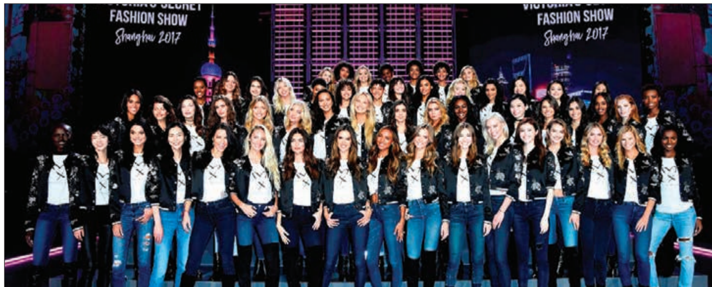
جانب من عرض أزياء لـ «فيكتوريا سيكريت» في شنغهاي في 2017

من جهة أخرى، تحل في المحل موظفات متمرسات تدربن خصيصا لمساعدة الزبائن على اختيار القياس المناسب، كما أن كل غرفة من غرف القياس مجهزة بجزر لطلب المساعدة إذا لزم الأمر.