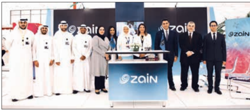
مسؤولو «زين» في جناح الشركة خلال المعرض

الفعالة في المعارض الوظيفية وتقديم الدعم لها في مختلف الجامعات والكليات على مدار العام في إطار استراتيجيتها للموارد البشرية، والتي تساهم من خلالها بتطوير العملية التعليمية في الجامعات والهيئات والمؤسسات التعليمية في الدولة بهدف توفير فرص العمل للشباب حديثي التخرج للعمل في القطاع الخاص.