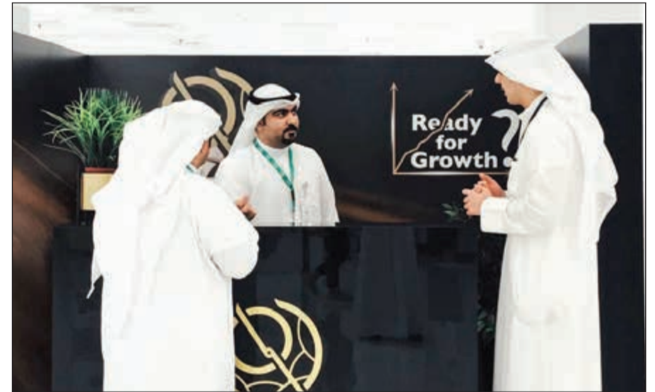
جانب من مشاركة البورصة في المعرض الوظيفي

شاركت بورصة الكويت مؤخرا، في المعرض الوظيفي الذي تقيمه جامعة الشرق الأوسط الأمريكية، والذي يهدف إلى إيجاد فرص وظيفية مستقبلية للطلبة وحديثي التخرج من الجامعة. وتأتي مشاركة بورصة الكويت في المعرض الوظيفي انسجاما مع التزامها باستقطاب المواهب الكويتية الشابة، تعزيزا لدورها الفاعل في دعم الشباب الكويتي وتنمية الاقتصاد الوطني ككل. ويأتي ذلك في إطار سعي بورصة الكويت نحو تطبيق معايير الاستدامة، وتعزيز مفاهيم